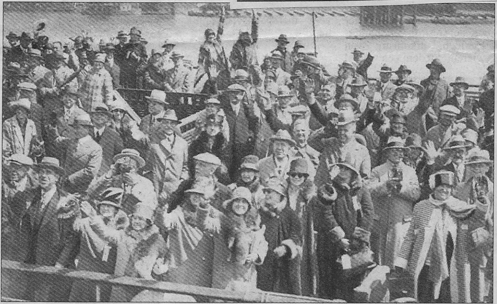
De Amerikaanse Rotariërs arriveerden in Oostende per boot.

In juni was het precies 70 jaar geleden dat het jaarlijks internationaal congres van Rotary plaatsvond in Oostende. Alhoewel de Oostendse club pas in 1925 door John Bauwens werd gesticht, kreeg Rotary al de eer dit grootse evenement in deze stad te mogen organiseren.