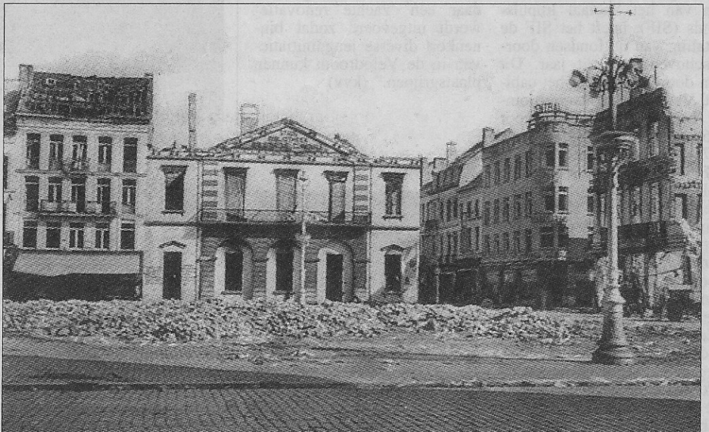
Een beeld van hetgeen van de Stadsbibliotheek, op de hoek van het Wapenplein en de Louisastraat, was overgebleven op het einde van de Tweede Wereldoorlog.