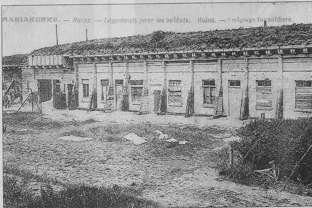
Soldatenlogies achteraan in de duinen van Mariakerke.

Na 1918 zijn er honderden foto's en prentkaarten gepubliceerd geworden om vooral te verkopen aan Britse toeristen op bezoek in Vlaanderen. Iedere na-oorlogse periode levert immers een massa toeris-