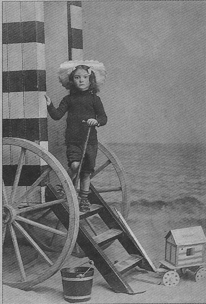
Een mooie herinnering aan de badkar en het strandspeelgoed (ca. 1905).