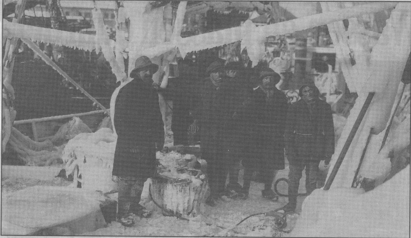
Een vissersschip dat in het gure weer Oostende kwam binnengevaren. De masten, ra's en de kabels zaten volledig vast door het ijs.

Iedereen die de speciale editie van „De Zeewacht” deze week in de brievenbus kreeg, heeft ongetwijfeld de prachtige foto van de Oostendse fotograaf Antony gezien. Enkele volkse mensen vervoeren een paar kostbare zakken kolen op een primitieve slede, getrokken door een hond.