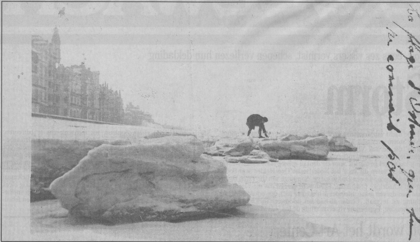
Ijsblokken in februari 1929 op het strand van Oostende