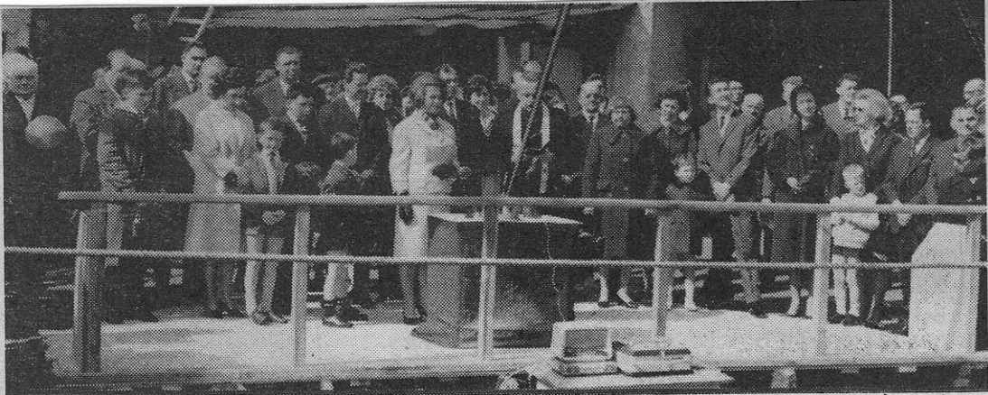
Talrijke aanwezigen woonden deze tewaterlating bij.