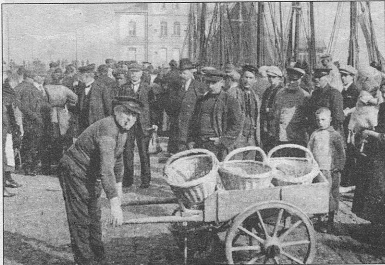
Een visser steekt een handje toe met de vismanden.

■ OOSTENDE – Waar is de tijd dat de Oostendse Visserskaai vol stond met viskarretjes? Aan de karretjes kon je een 'poosje' vis kopen, of het deel van de vis dat de bemanning had meegekregen voor eigen gebruik.