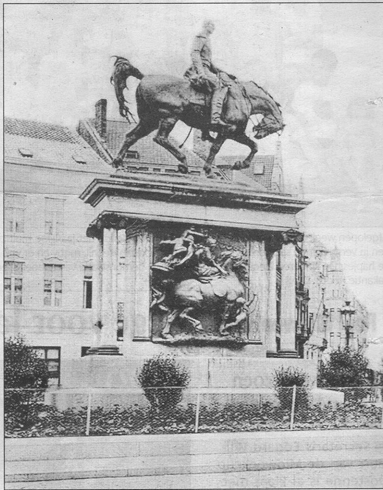
Een engel plaatst een kroon op het hoofd van België, die hier gesymboliseerd staat door een jonge vrouw op een Brabants ros.

Het Leopold I-monument is het eerste monument van onze stad en heeft een niet te onderschatten gewicht van 2,7 ton. Toen het monu-