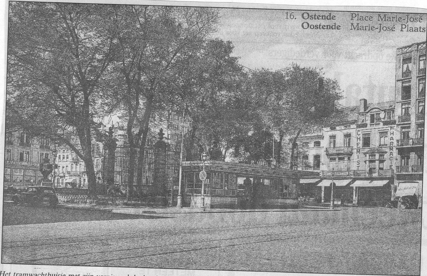
Het tramwachthuisje met zijn vernieuwd doch minder sierlijk dak (circa 1948).

Men spreekt er de laatste tijd vaak over dat het tramhuisje op het Marie-Joséplein zal afgebroken worden en vervangen worden door een moderner. In feite is dit wachthuisje al lang niet meer zo sierlijk als het vroeger was.