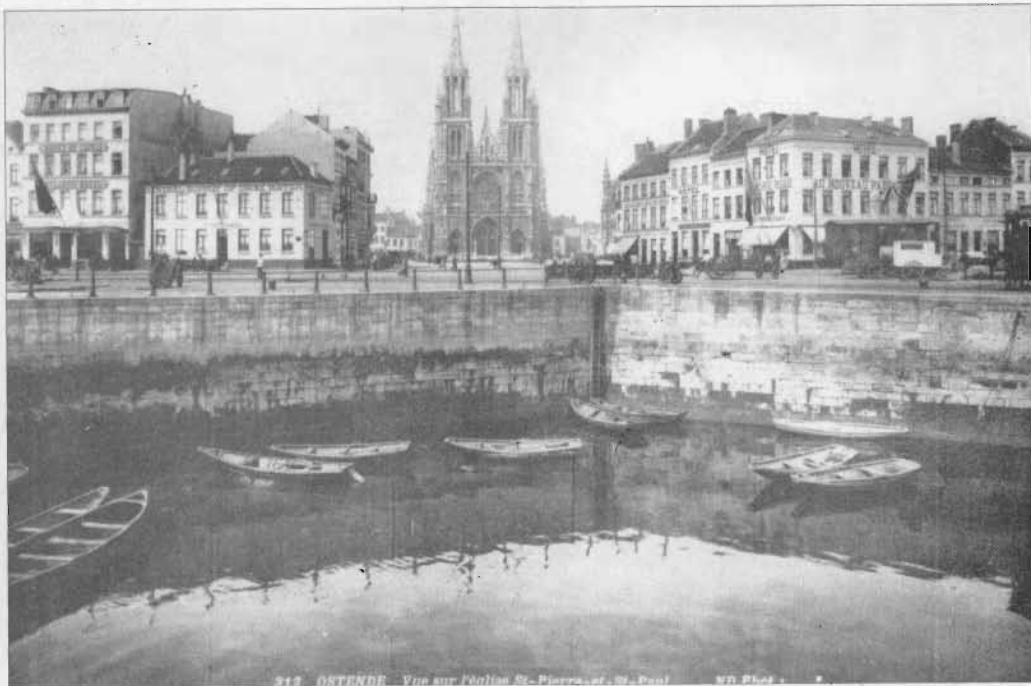
Het Sint-Petrus en Paulusplein en de "dode kreek" omstreeks 1913, met op de voorgrond het WATERHUIS.