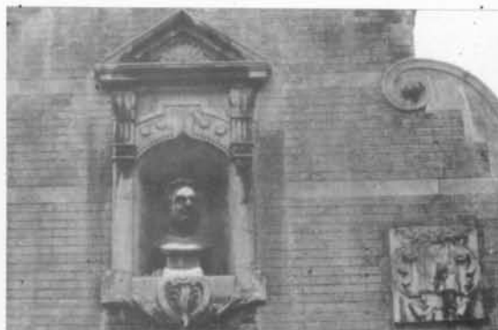
De kop van VEUILLOT en de uil op het boek.