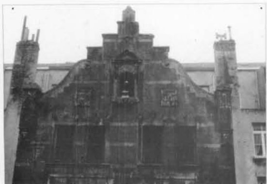
Een zicht op het bovengedeelte van de gevel