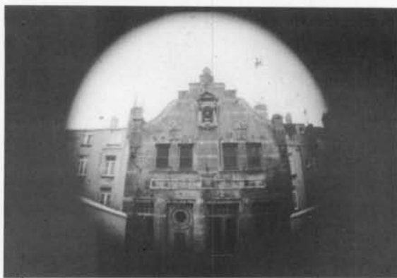
De gevel tegen een achtergrond gevormd door de achterkant van de huizen in de Peter Benoîtstraat.