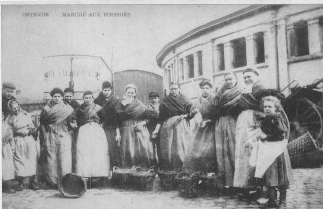
Een mooie prentkaart van 1900 aan de oude Vismijn (in de volksmond "De Cirk., genoemd) met enkele vistleursters