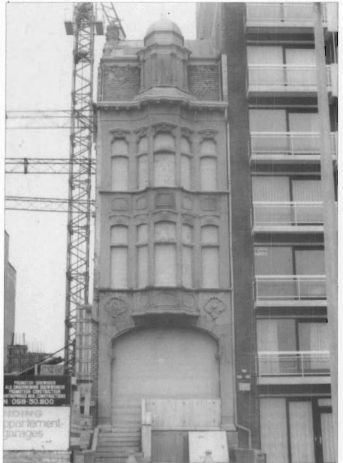
Villa Doris Zeedijk 117 Middelkerke