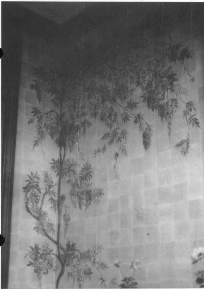
Terrashoek met struikmotief op veelkleurige faience