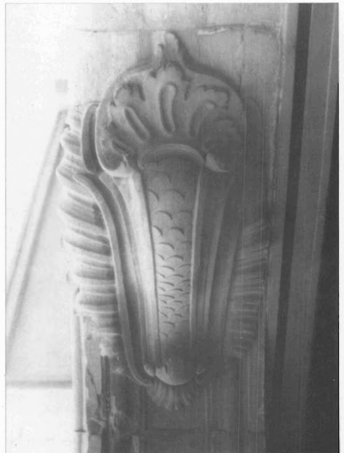
Sluitsteen aan terras