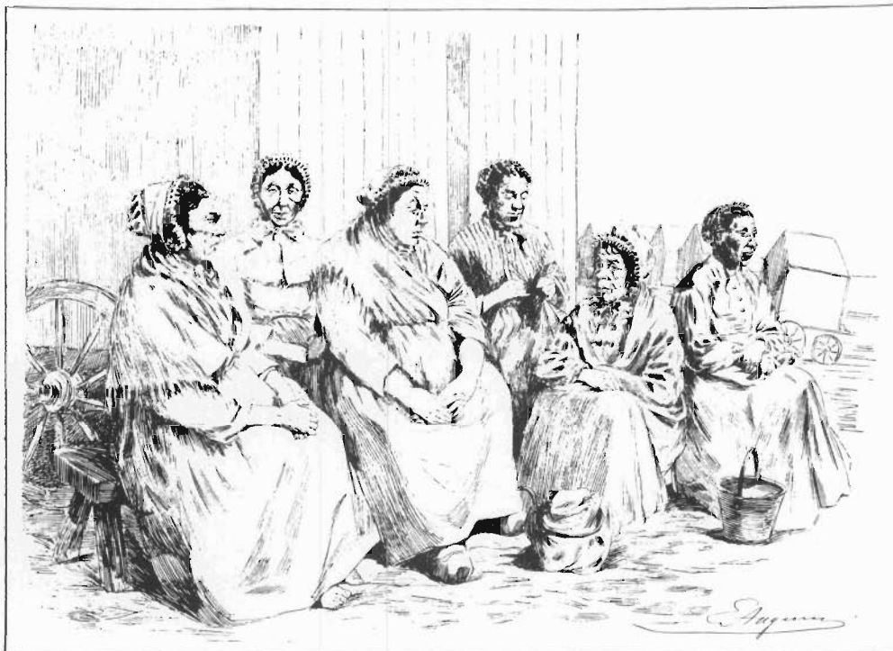
Mesdames les « Préposées aux Bains d'Ostende ».