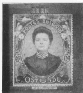
LE BON Photo timbre