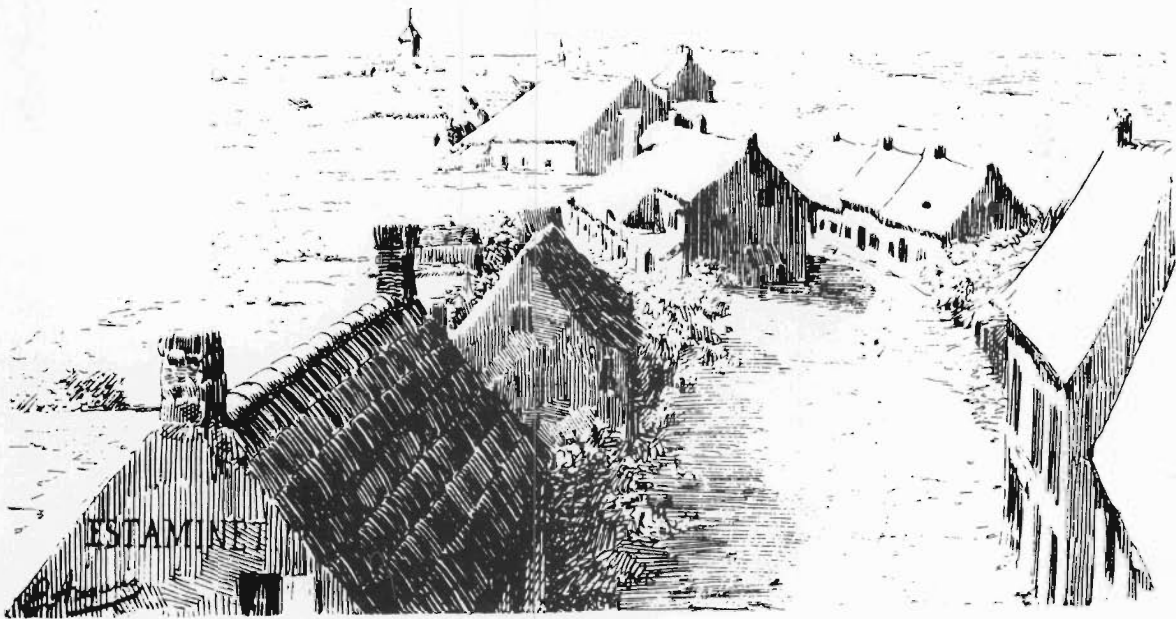
Le village de Mariakerke en 1890.