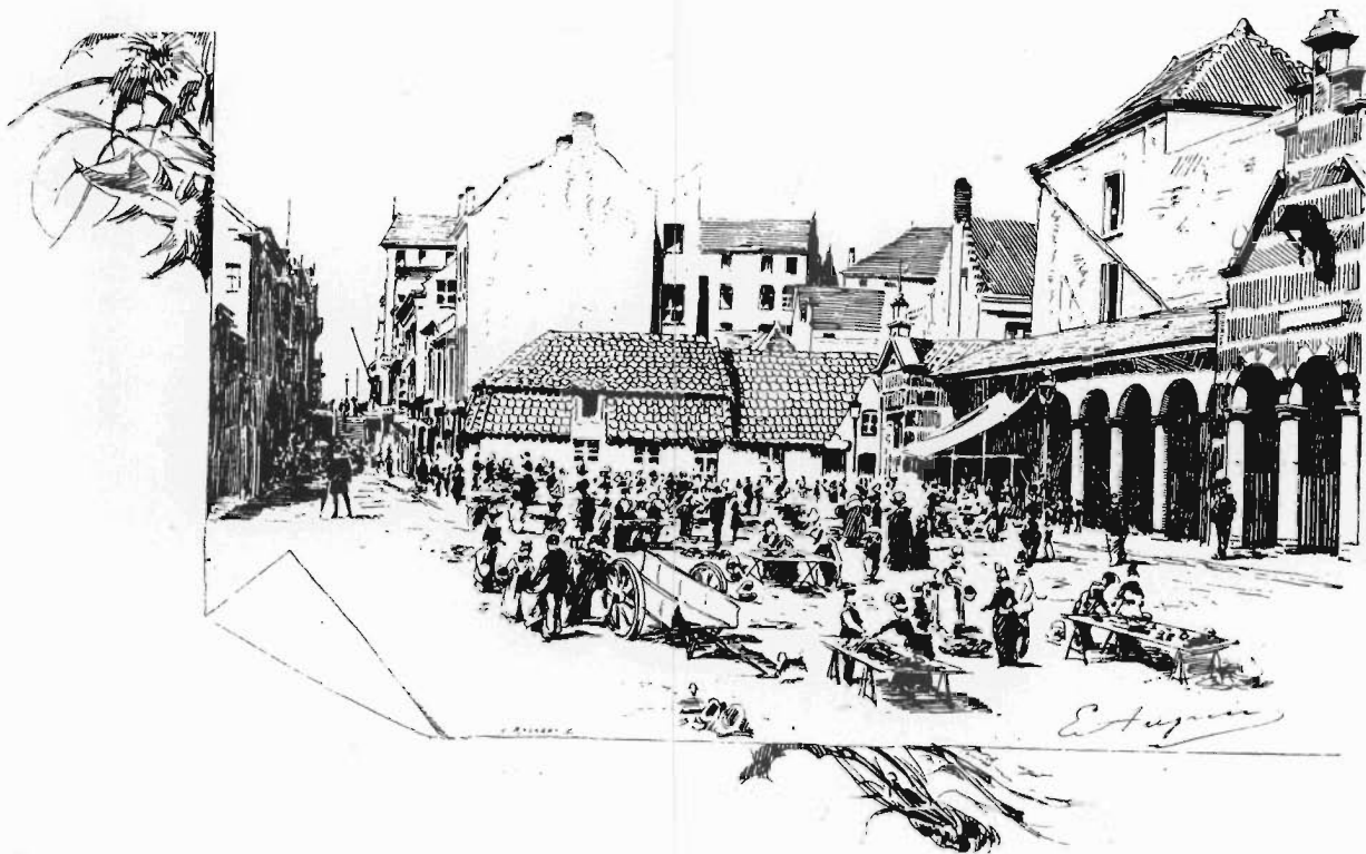
14. La Place du Marché, à Blankenberghe.