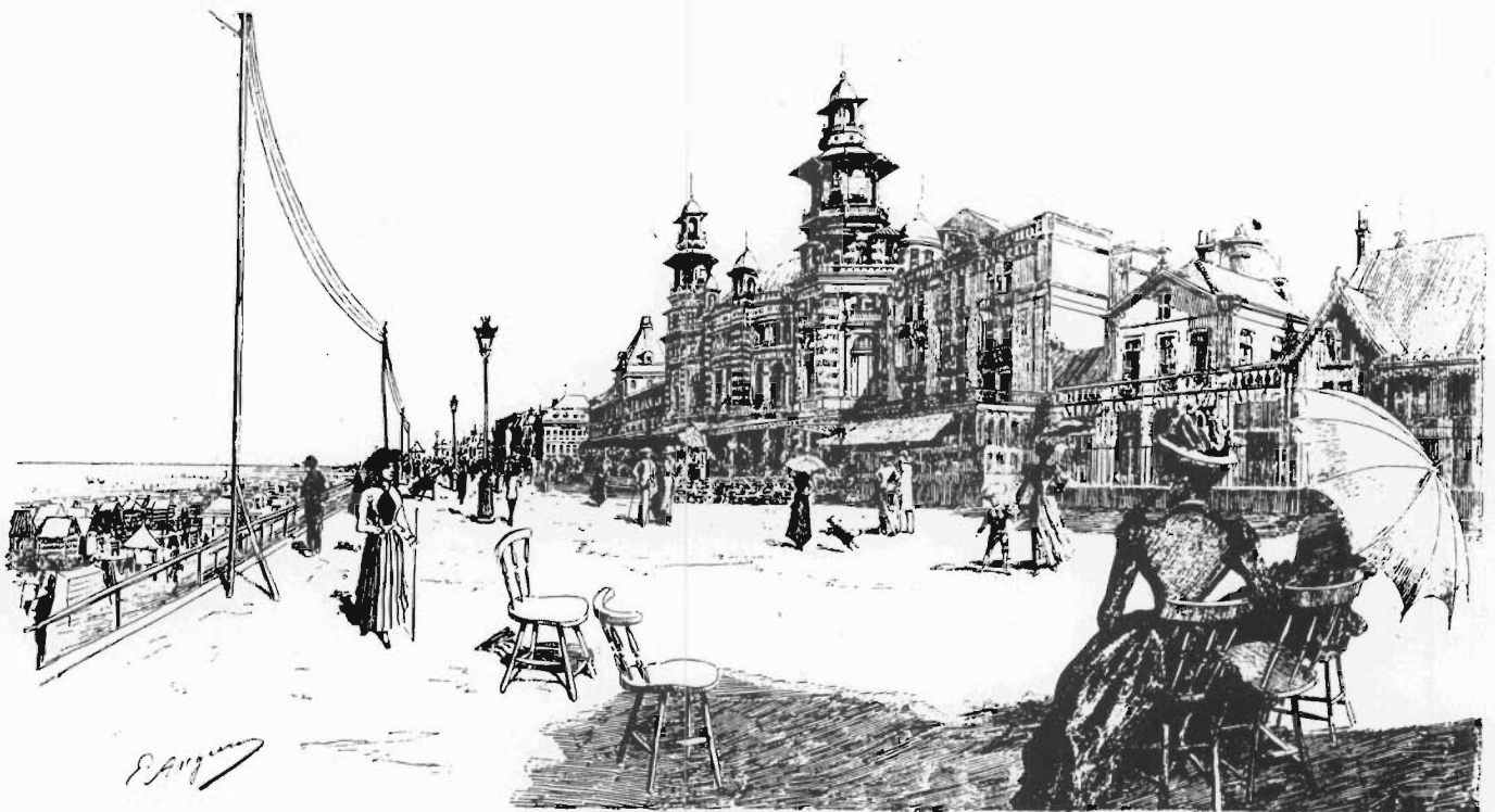
26. Le Casino et la digue, vers midi.