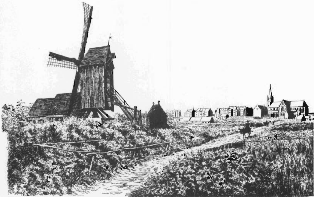
37. Le Moulin de Heyst.