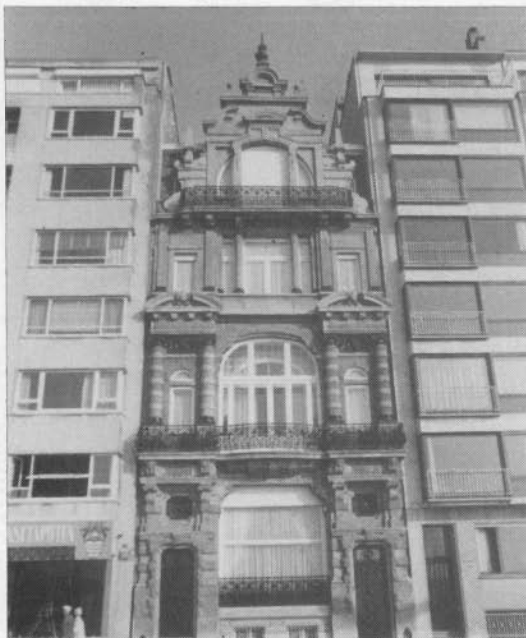
Enige getuige van Oostend's grootheid uit de Belle-époque: villa Maritza.