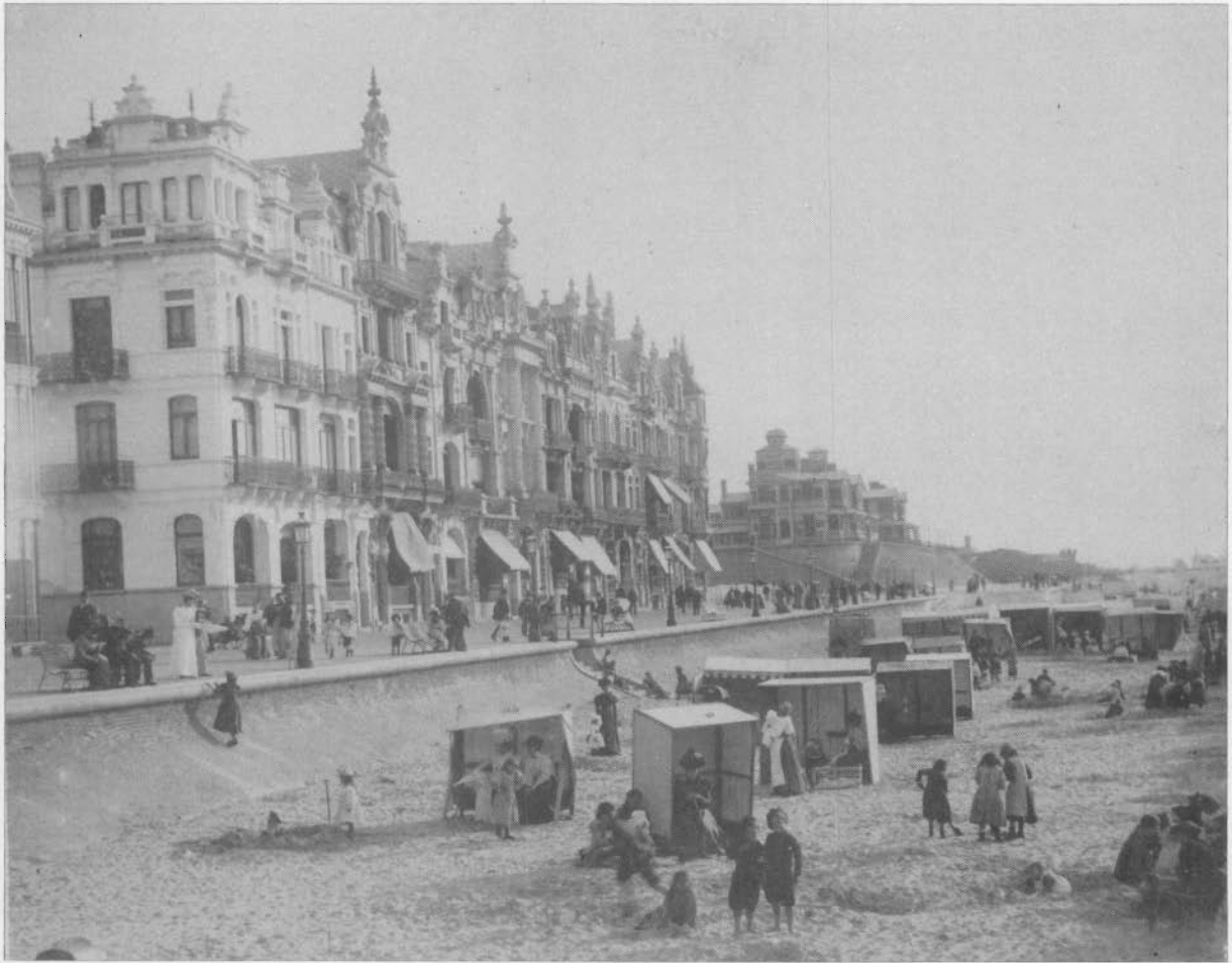
De Zeedijk, gezien van aan de hoek van de Kesselbergstraat, met de sierlijke dijkvilla's, het Koninklijk Chalet en de duinen, waar later de Kon. Galerijen zouden gebouwd worden. Naast de hoek ziet men villa Rosenda (nu Maritza). (foto circa 1895)