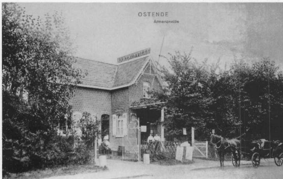
De "ARMENONVILLE", waar de balboogvereniging "SINT-JORIS" gevestigd is, werd ook helemaal verbouwd.