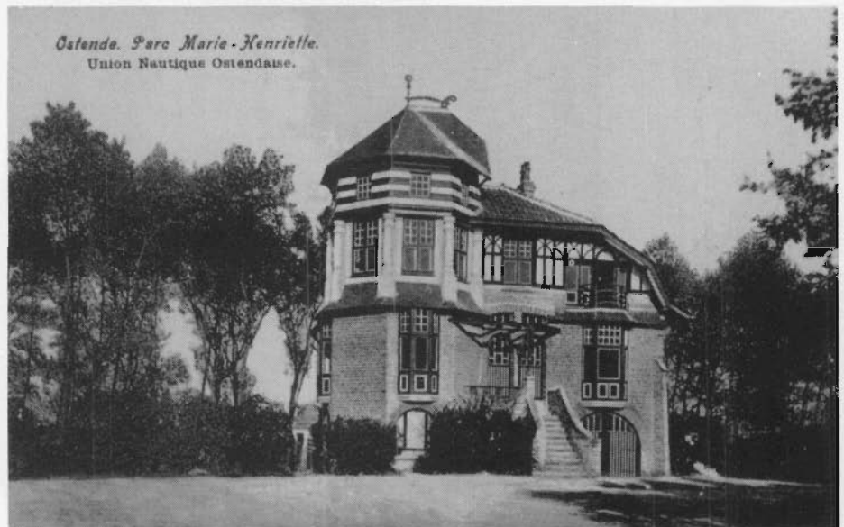
Het clubhuis van de Oostendse roeivereniging. Toen gelegen nabij de oude vaart (Gedempt in 1937). Het vervallen clubhuis werd enkele jaren geleden afgebroken.