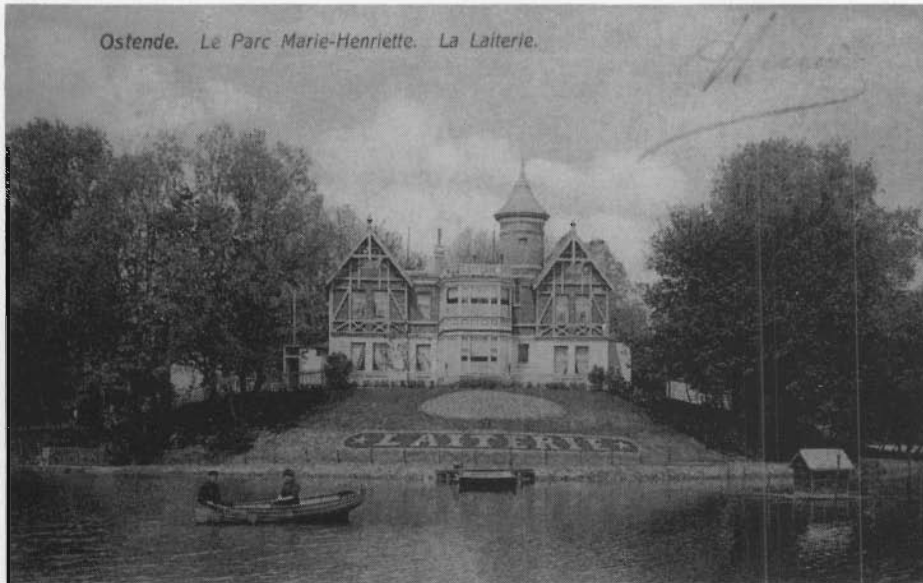
Het oude "LAITERIETJE", thans voor de derde maal herbouwd als "HET KONINGINNEHOF".