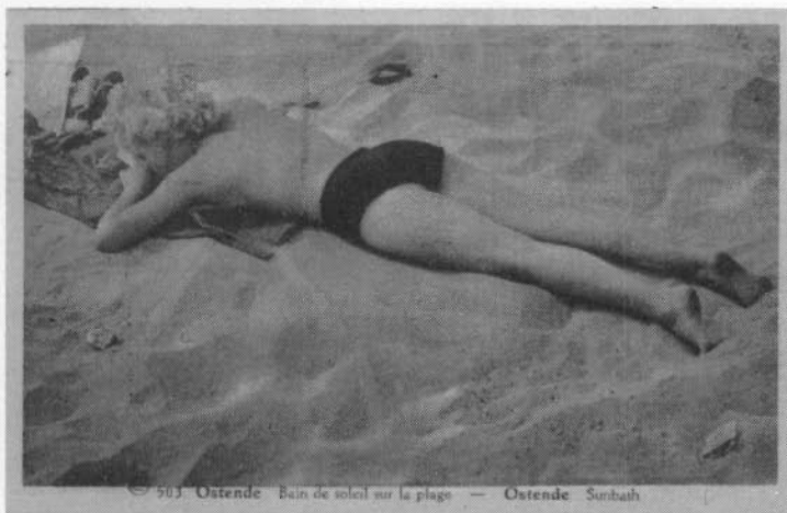
Een voorloopster van de monokini (Prentkaart verzonden uit Oostende in 1939!)