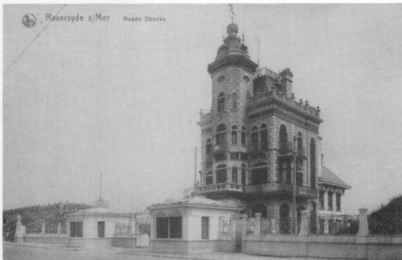
Een vooraanzicht met de twee paviljoentjes (circa 1905)