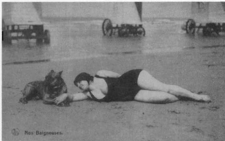
Reeds een ontblote tepel (Prentkaart ca. 1925)