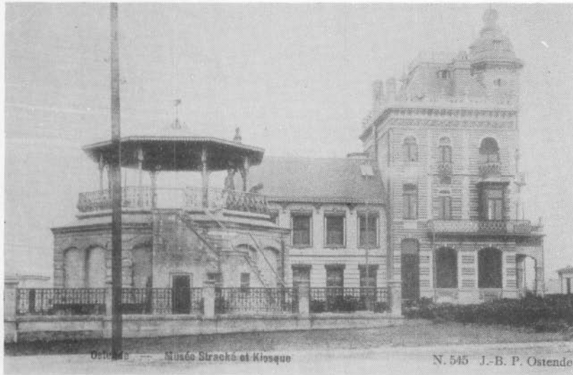
Een zijzicht met de villa en de muziekkiosk (circa 1900)