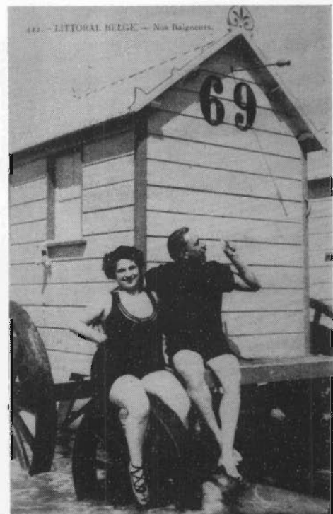
Prentkaart met veel allusie (1910)