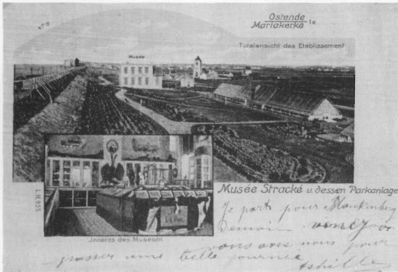
Een der eerste prentkaarten van het museum (circa 1898)