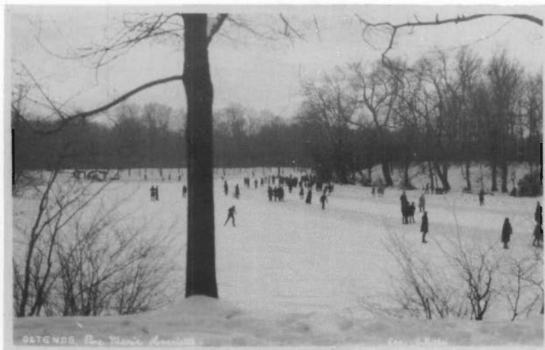
Vrijgemaakte schaatsbanen op het besneeuwde ijsveld (1931?). Hoelang is het nu ook weer geleden dat het bosje "toelag"?