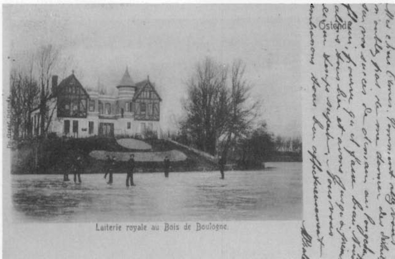
Op het ijs nabij "Het Laiterietje" (voor 1905)