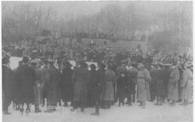
Duitse soldaten en mariniers in 1917