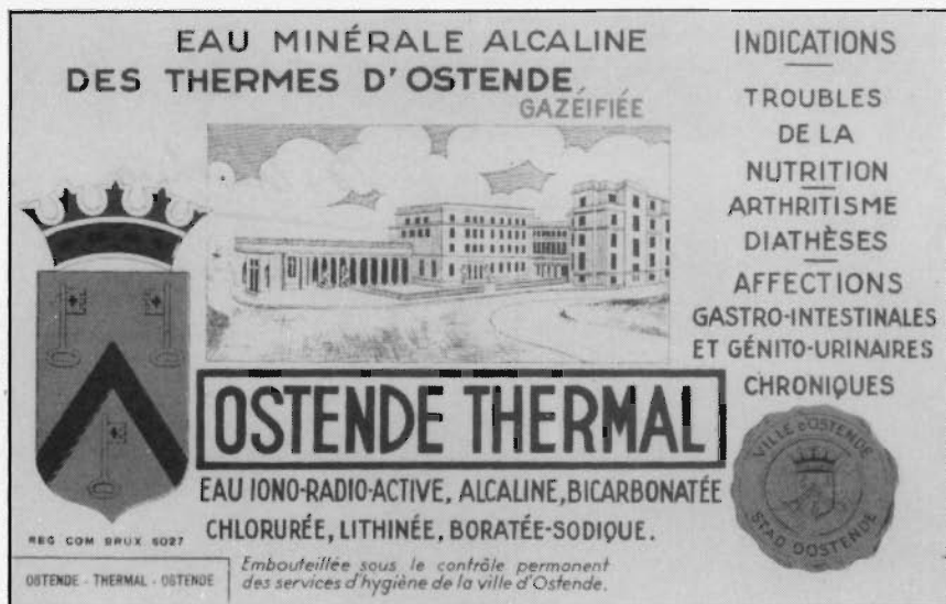
Het mooie flessenetiket met het Thermal Instituut er op. Het befaamde "eau d'ostende" behoort nu ook na een halve eeuw tot het verleden. Zal de bron nog eens terug werken?