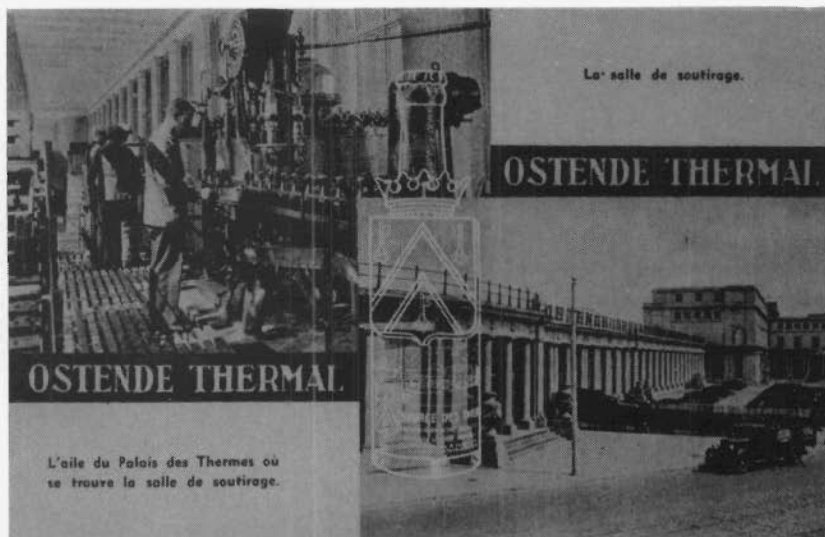
Publiciteitskaart met de bottelmachine voor het Oostends bronwater.