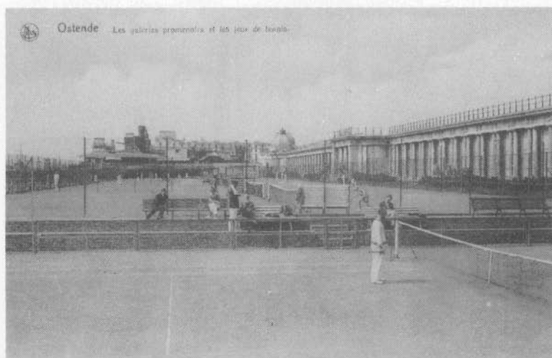
In de Hovingen van de Koninklijke Galerijen (1925)