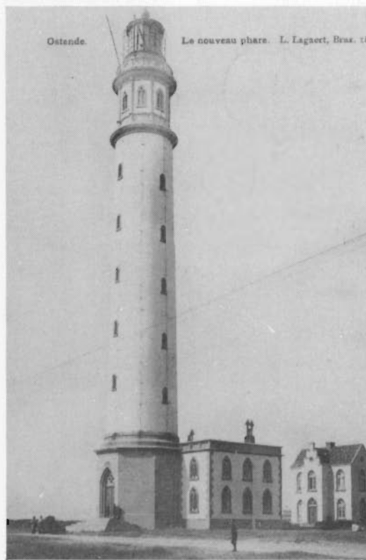
De tweede vuurtoren werd aan de oostzijde van de haven gebouwd en werd in 1859 in gebruik genomen. De Duitsers lieten hem in 1917 in de lucht vliegen. Lange tijd dacht men dat het de Engelsen waren die de toren van uit zee beschoten hadden. Deze sierlijke vuurtoren was 53 m hoog.