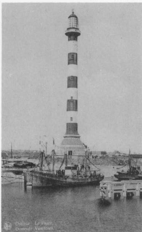
De derde toren werd in 1926 in gebruik genomen en door de Duitsers bij hun aftocht in 1944 neergehaald. Zijn hoogte was 62 m. De witte en rode banden waren er in 1938 bijgeschilderd geworden.