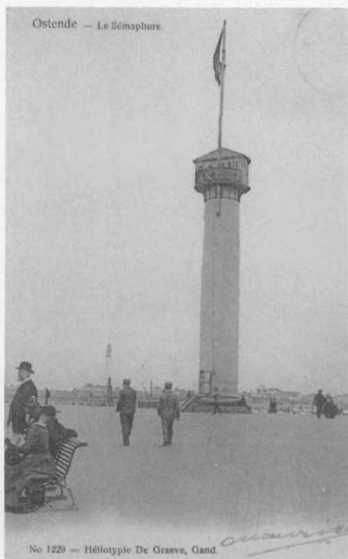
De eerste vuurtoren dateert van 1772. In de volksmond noemde men het "de Vlaggestok" toen de toren als semafoor met tij- en stormvlag dienst deed. In 1943 door de Duitsers afgebroken. (Die vuurtoren stond waar nu het Monument van de zeelieden staat).