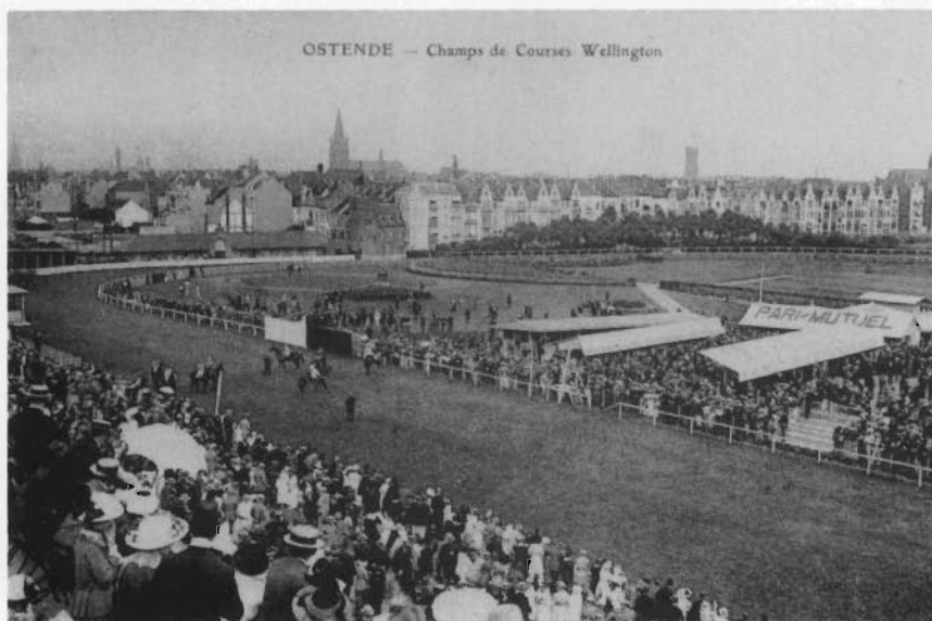
Een zicht op de renbaan, richting Sportstraat (circa 1910)