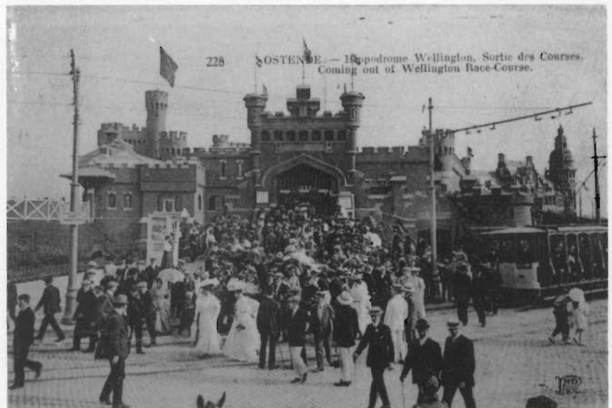
Het oude Fort Wellington met de massa die de renbaan verlaat. Open trammetjes rijden naar het station (circa 1905)