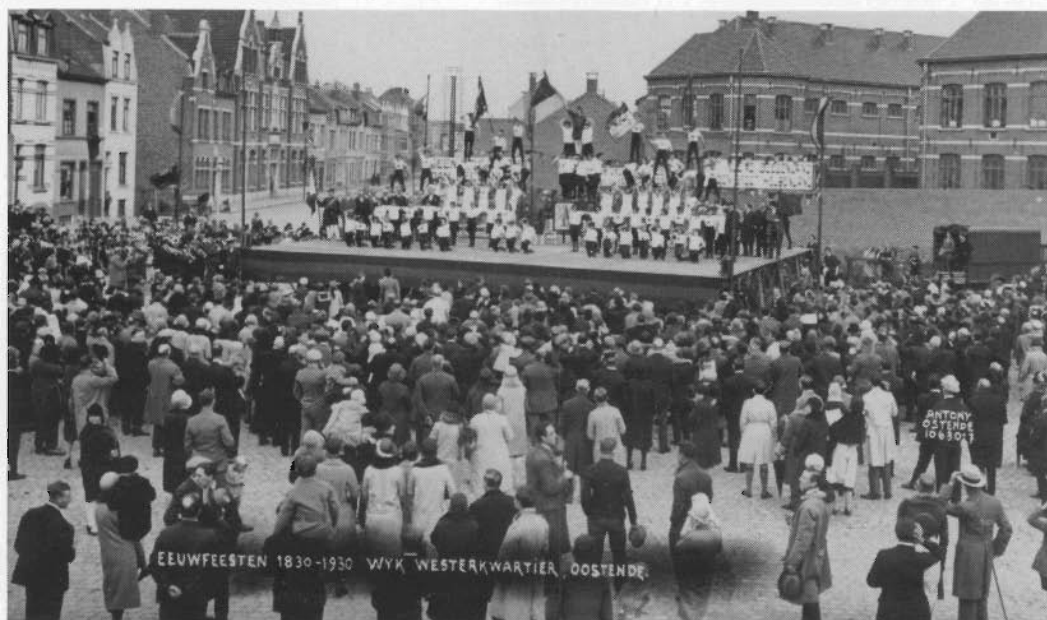
Antony bij de wijkfeesten: Optreden turngroep ter gelegenheid van het honderdjarig bestaan van België op het Gerechtsplein nabij Conscienceschool (1930).