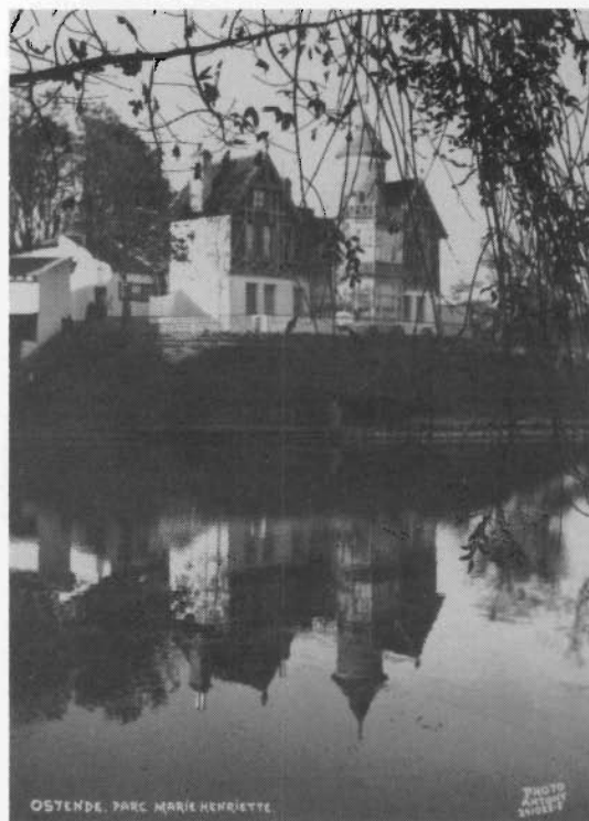
Antony de poëtische fotograaf: Het "Laiterietje" in het Maria-Hendrikapark (1922)