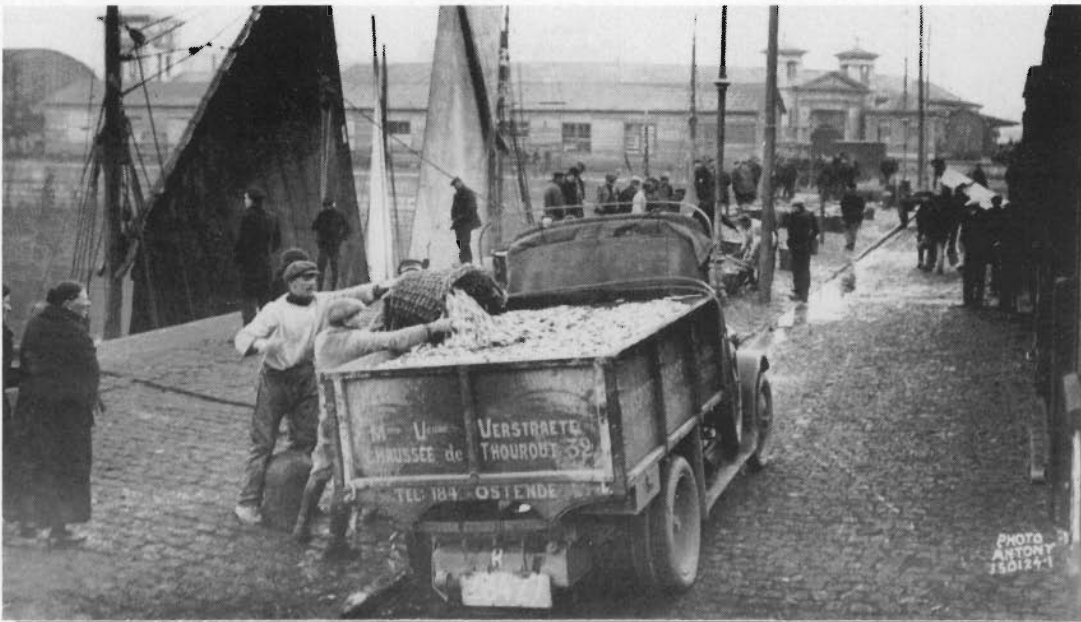
Antony en de visserij: Vis laden nabij de oude Vismijn (1934).