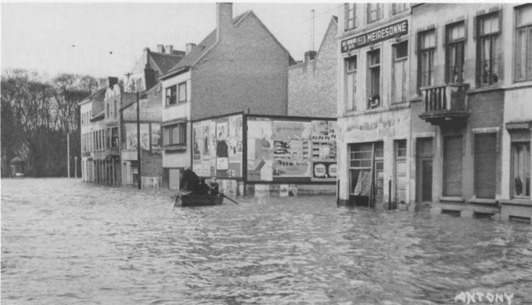
Antony en de grote overstroming van 1 februari 1953: hoek Jozef II straat en Aartshertoginestr.