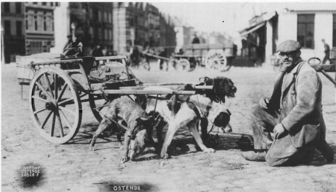
Antony en de straat-toneeltjes: een der laatste hondekarretjes (1928).