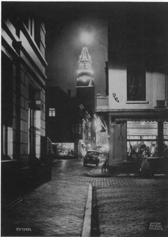
Antony als fotograaf van avond- en nachtzichten: Hoek Groentemarkt en Capucijnenstraat. In de achtergrond de verlichte stadshuistoren (1930).