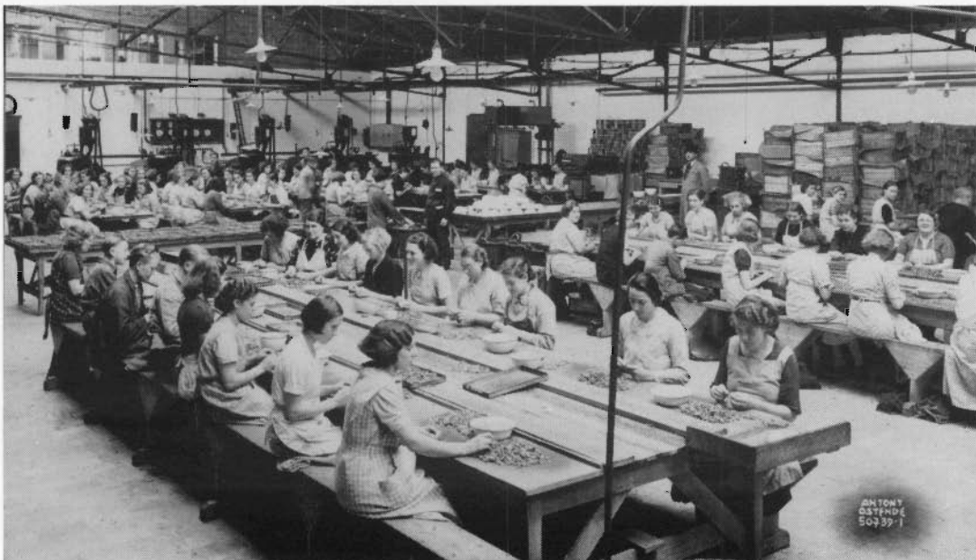
Antony en de visnijverheid. De garnalpellerij "Ostendia" (Sas-Slijkens) (1939)