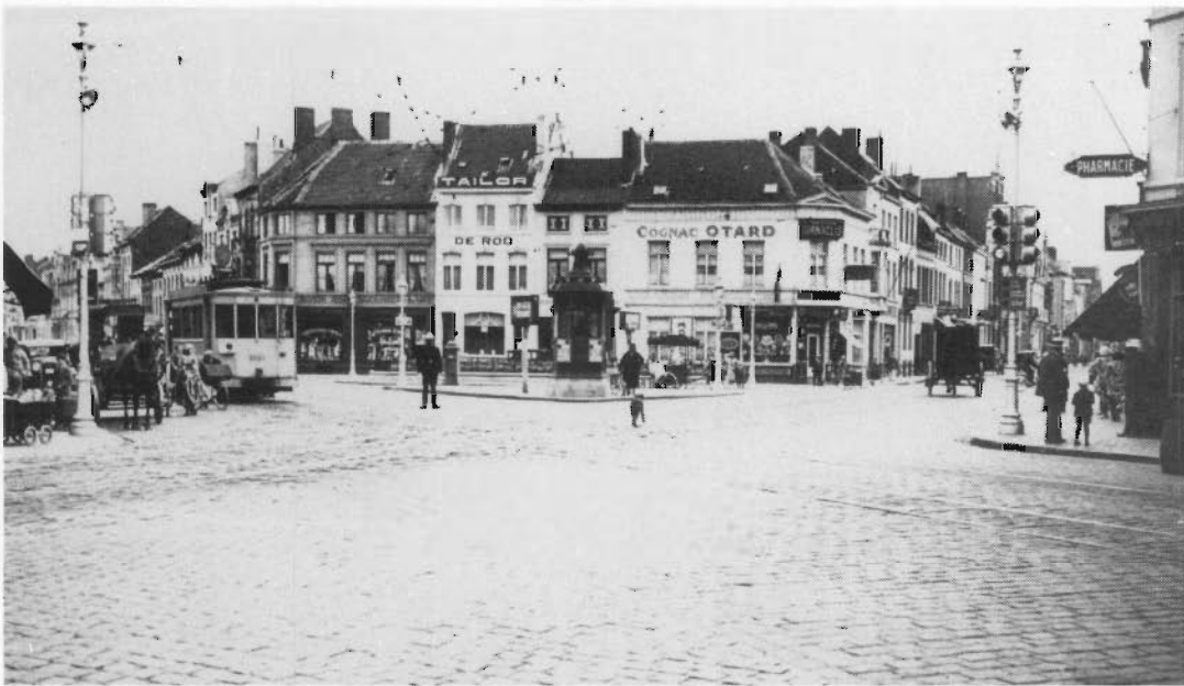
Antony en het Oostends stadsbeeld: Petit Paris met de eerste signalisatie-lichten (1931).