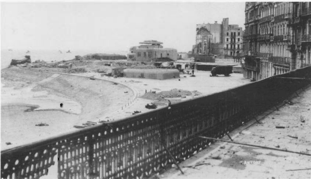
Antony en het oorlogsgeweld: Puinen van het Kursaal met bunker (1945).