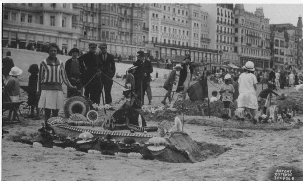
Antony en de strandfolklore: Etalagewedstrijd voor kinderen (1926).