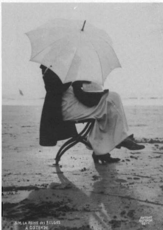
Antony en het Koningshuis: Koningin Elisabeth lezend aan de vloedlijn (1911).