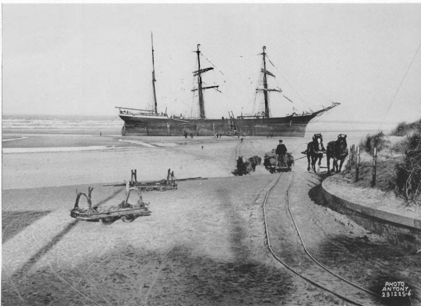
Antony de actualiteitsreporter: De schipbreuk van de driemaster "OBOBRITA" met lading guano te Den Haan (1925).