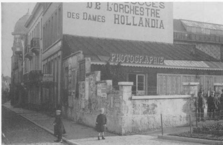
Het laboratorium van fotograaf Lebon langs de Louisastraat.