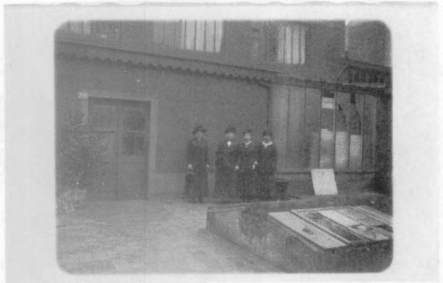
Studio met huisnummer 36 in de Van Iseghemlaan.