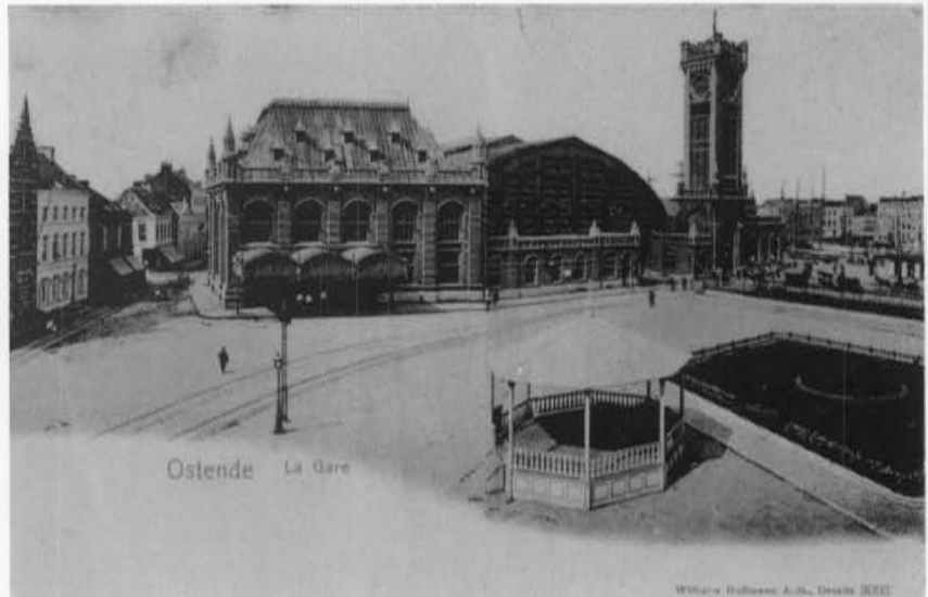
Vandersweepplein (thans Ernest Feysplein)