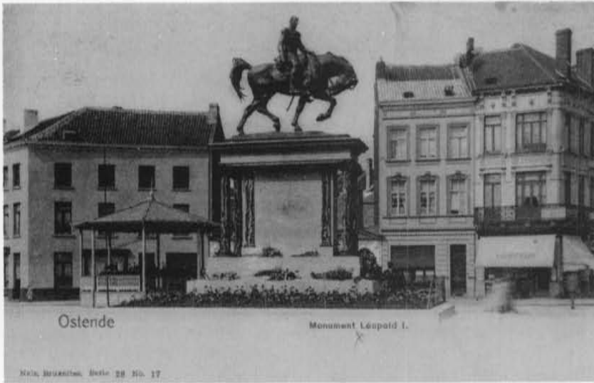
Leopold I plein