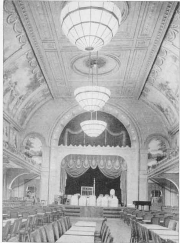
De ambassadeurszaal (circa 1935)