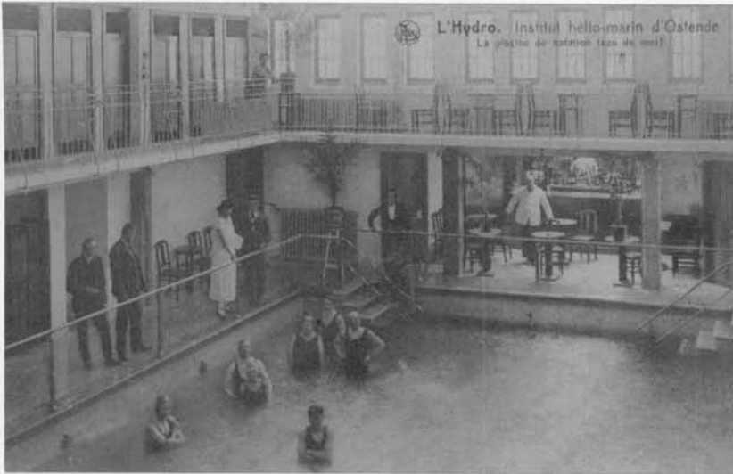
In 1924 was de hydro op de zeedijk het verste gebouw.