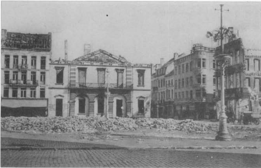
De verwoesting van de stadsbibliotheek