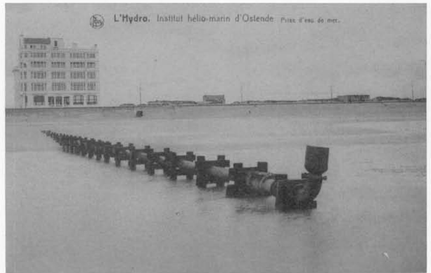
voor de behandeling met zeewater werd het water rechtstreeks uit zee gepompt.