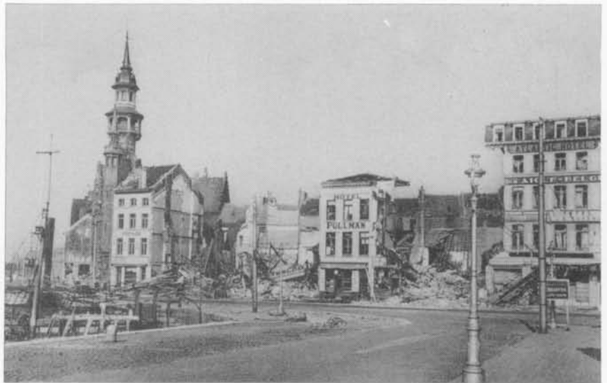
De vernieling van de gebouwen langs de Vindictivelaan