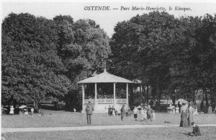
Een muziekkiosk nabij het "Laiterietje" (circa 1905)