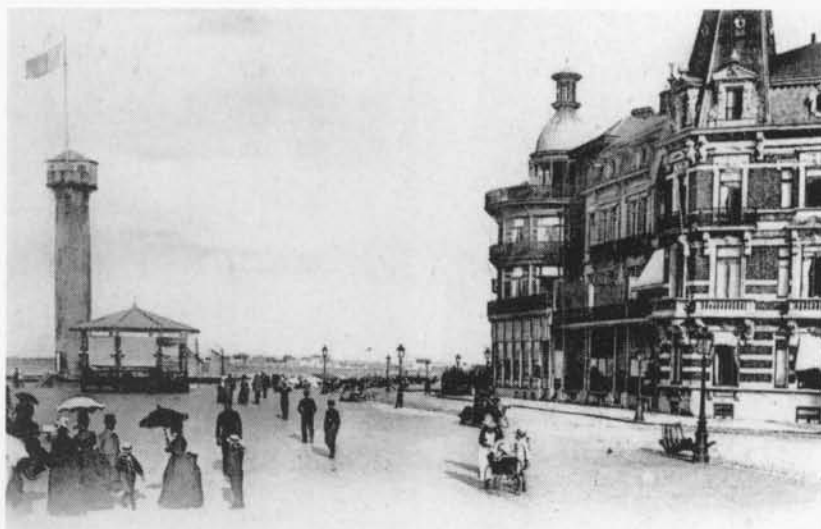
De muziekkiosk nabij de "Vlaggestok" (circa 1900)