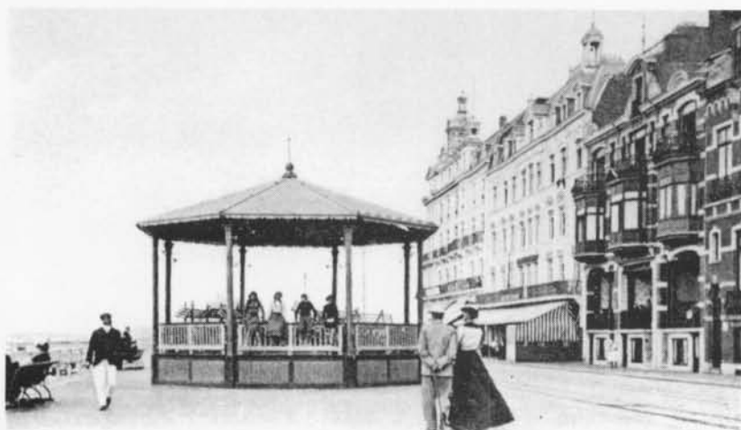
Digue de Mer