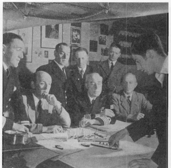
Eindexamen ! Voorzitter van de examercommissie is de Belgische inspecteur voor de Scheepvaart. Rechts achter hem de Directeur van de school.

De namen van de personen op de onderste foto's zijn ons onbekend. Indien één van onze lezers een persoon moest herkennen dan mag de naam medegedeeld worden aan het Secretariaat van de Plate.