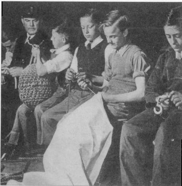
Leerlingen van de vissersschool te Brixham. Er wordt hier veel tijd besteed aan praktische oefeningen.