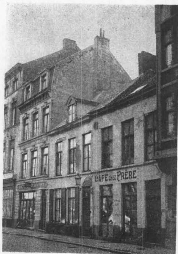
CAFÉ CHEZ FRÈRE