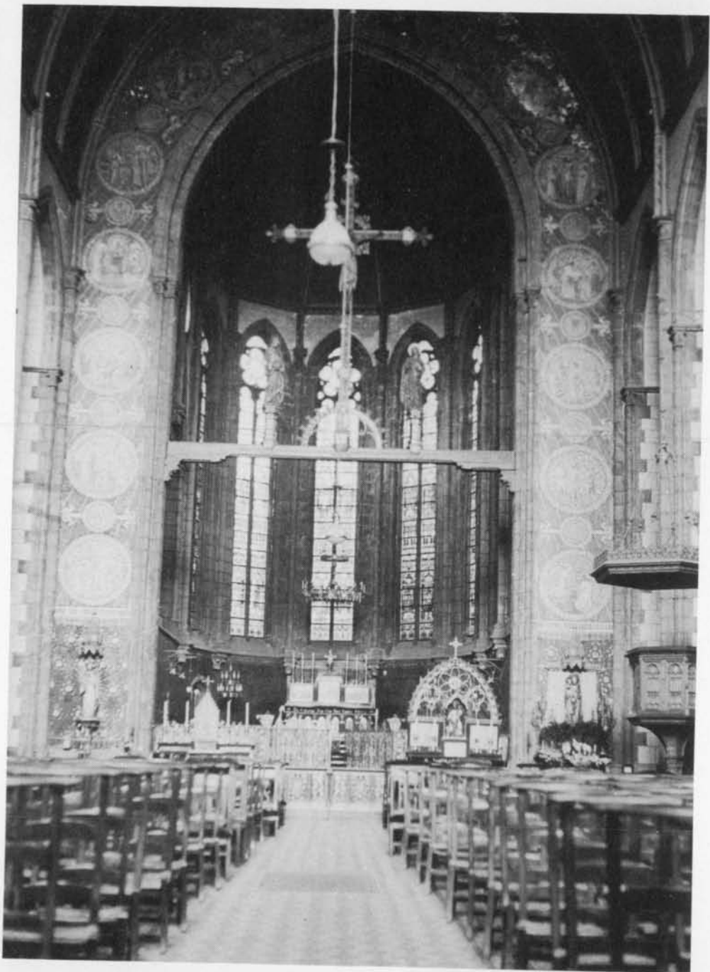
DE DOMINICANENKERK... VERDWENEN NEO GOTISCHE PRACHT