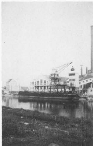
Het lossen van kolen vanuit een lichter, voor de bevoorrading van de elektriciteitscentrale van Sas-Slijkens.