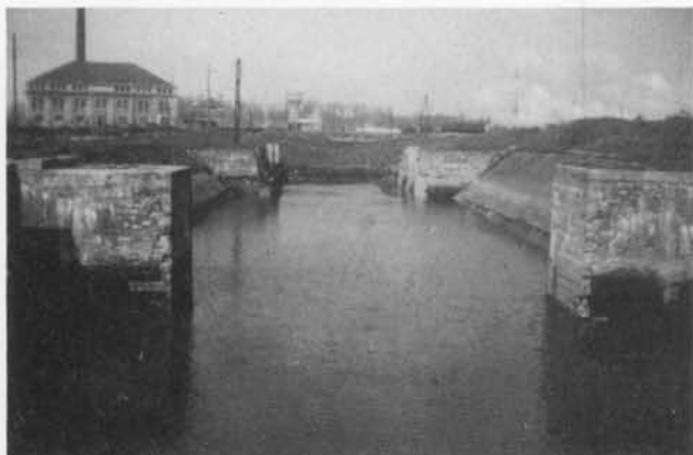
April 1950. De oude Conderdam Sluis op de gedempte afleiding van de vaart Brugge-Oostende. Op de achtergrond de eerste Oostendse verbrandingsoven.