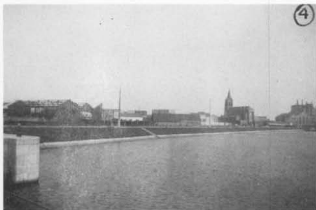
April 1950. Het Sasdok. Op de achtergrond de elektriciteitscentrale van Sas-Slijkens, "Electricité du Littoral" en de kerk van Sas-Slijkens, Molendorp.