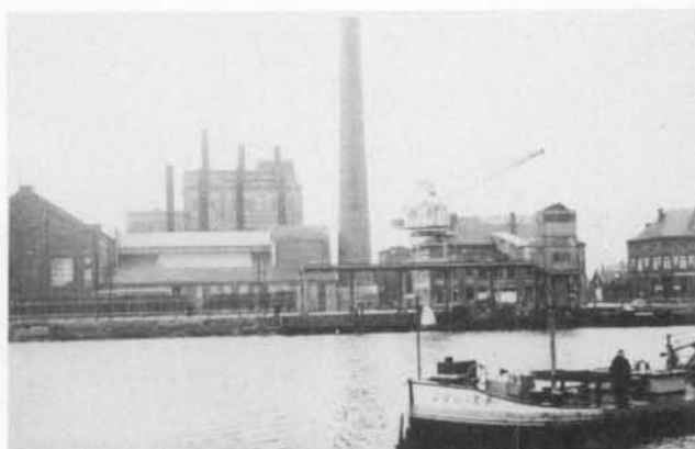
De elektriciteitscentrale van Sas-Slijkens