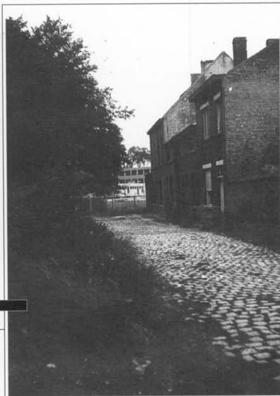
2. Srotslop (Foto: 10.07.1974)