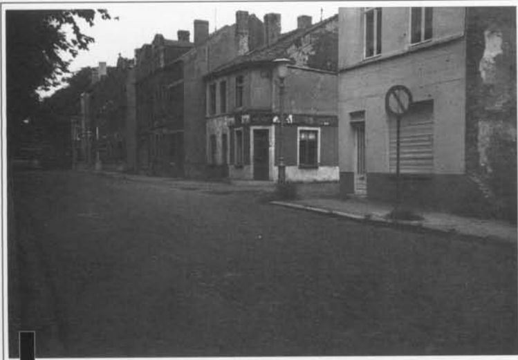
1. Leffingestraat (Foto: 10.07.1974)