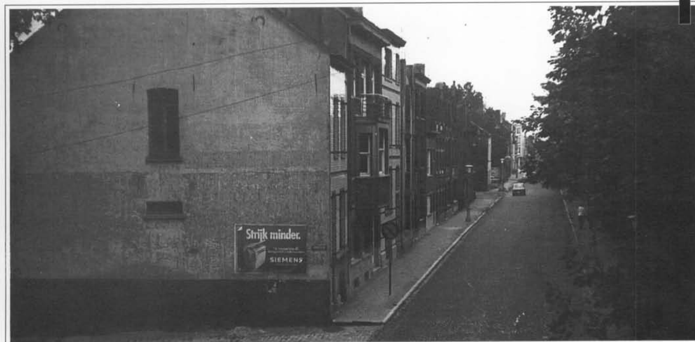
4. Huizen in de Leffingestraat (10.07.1974); gesloopt in oktober 1975.