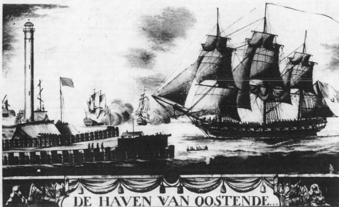
Wenzeslas WIEDEN : De haven van Oostende

Bredene Oostende Oostende Oostende Oostende Gistel