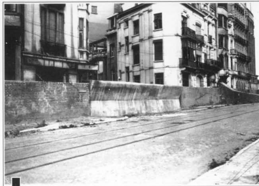
HOFSTRAAT - ALBERT I PROMENADE