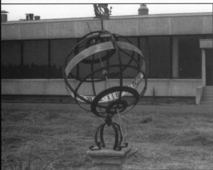
De Equatoriale zonnwijzer voor het hoofdgebouw van DAIKIN