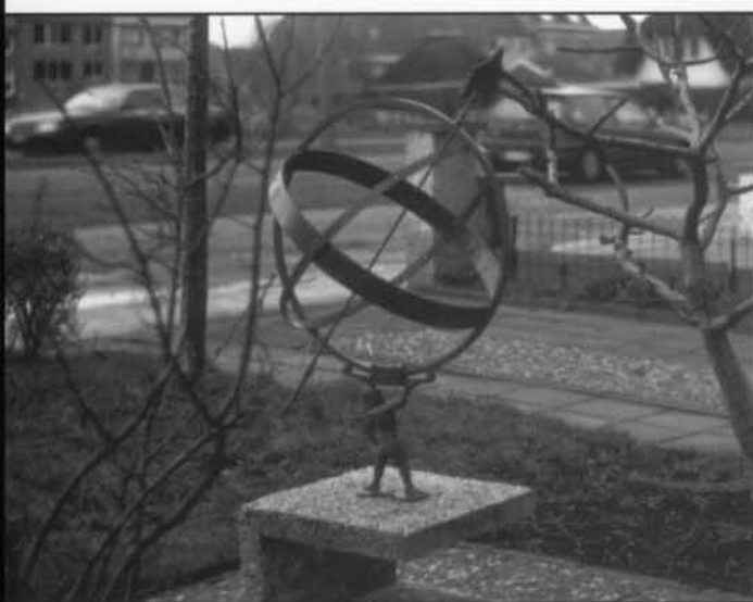
De Equatoriale zonnwijzer Elisabethlaan 210