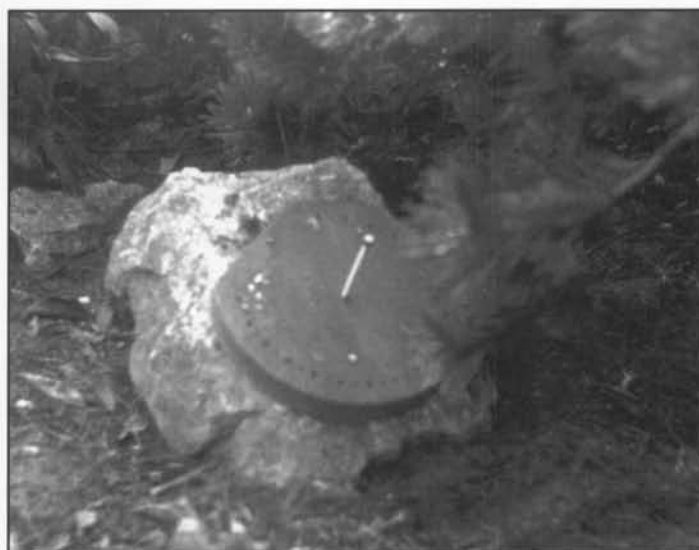
De Noordwijzer Roerdompstraat 13