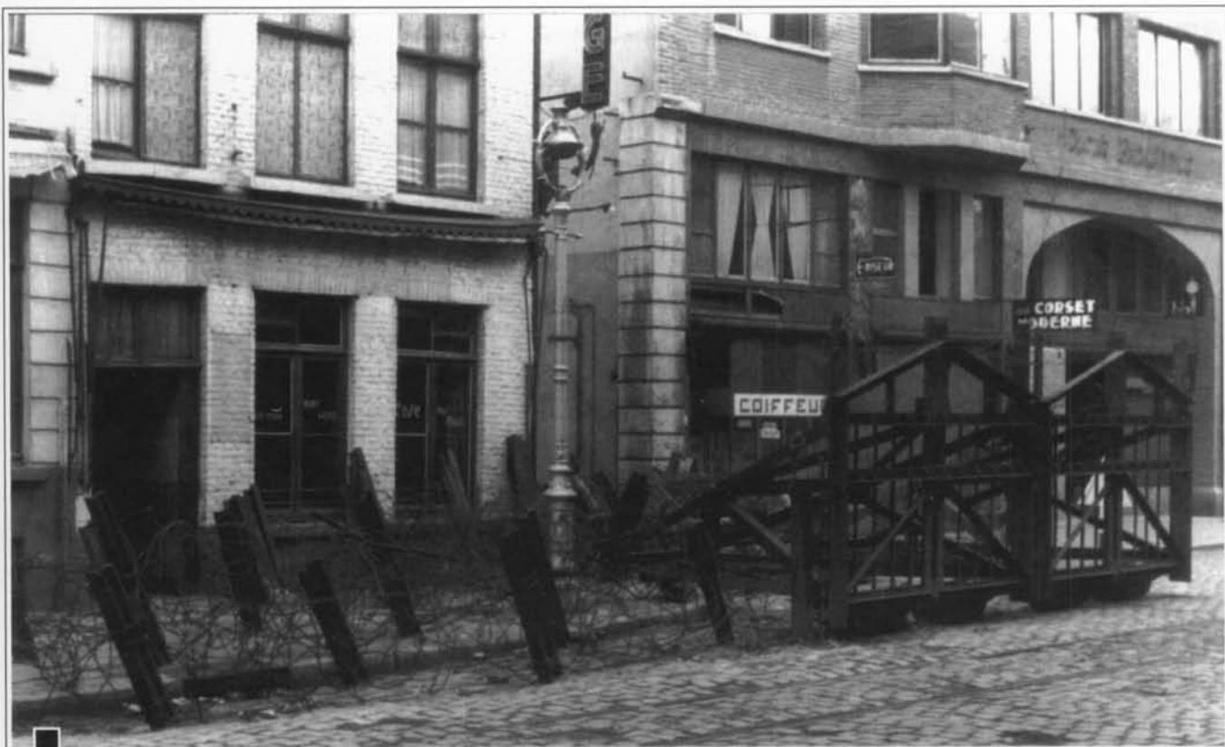
VOORBEREIDE VERSPERRING OP DE HENDRIK SERRUYSLAAN