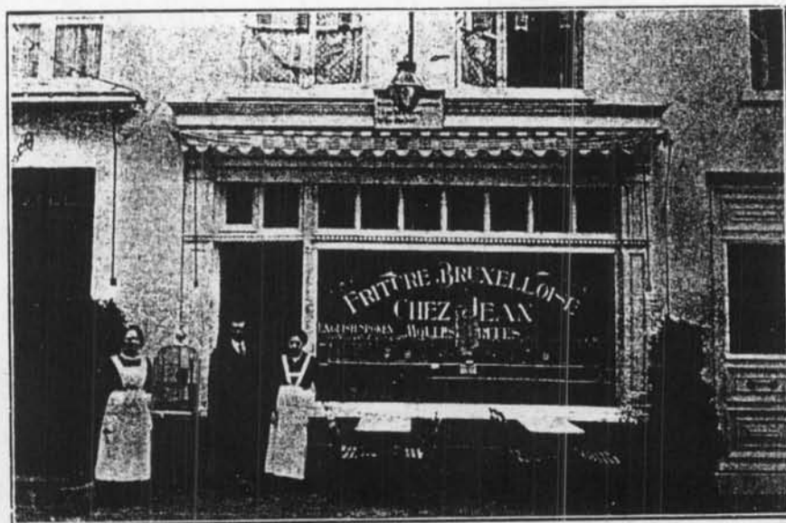
FRITURE BRUXELLOISE, CHEZ JEAN, RUE LONGUE, 45, OSTENDE

ZELDZAME PRENTKAART VAN EEN ENKEL BIJ NAAM UIT OOSTENDE GEKEND FOTOGRAFIEATELIER