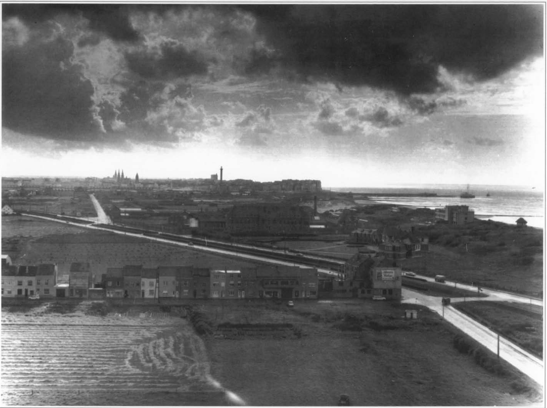
OOSTENDE UIT HET OOSTEN GEZIEN - ca 1963