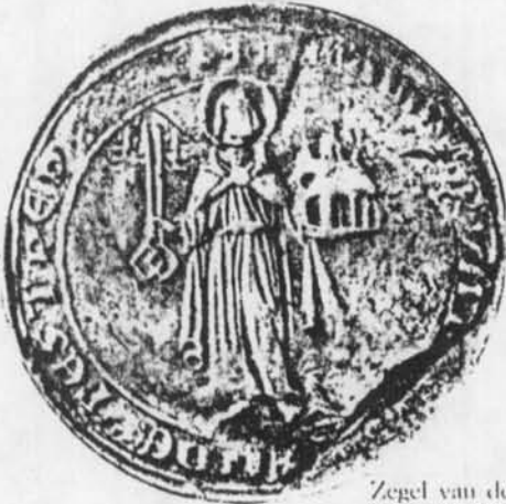
Zegel van de stad Oostende, 1504. (ARA. Brussel, Verzameling zegelafdructs, nr. 6468).