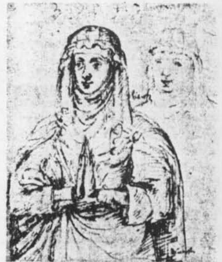
- Margaretha van Constantinopel naar schetsen van Antoon de Succa, hs. II, 1862, Kon. Bibl., Brussel