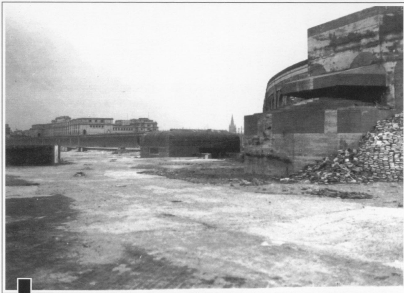
ROYAL PALACE EN THERMEN