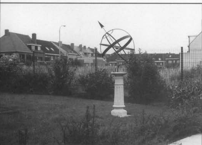
Poolstijlzonnewijzer van het equatoriale type Sluisvlietlaan 76 te Bredene