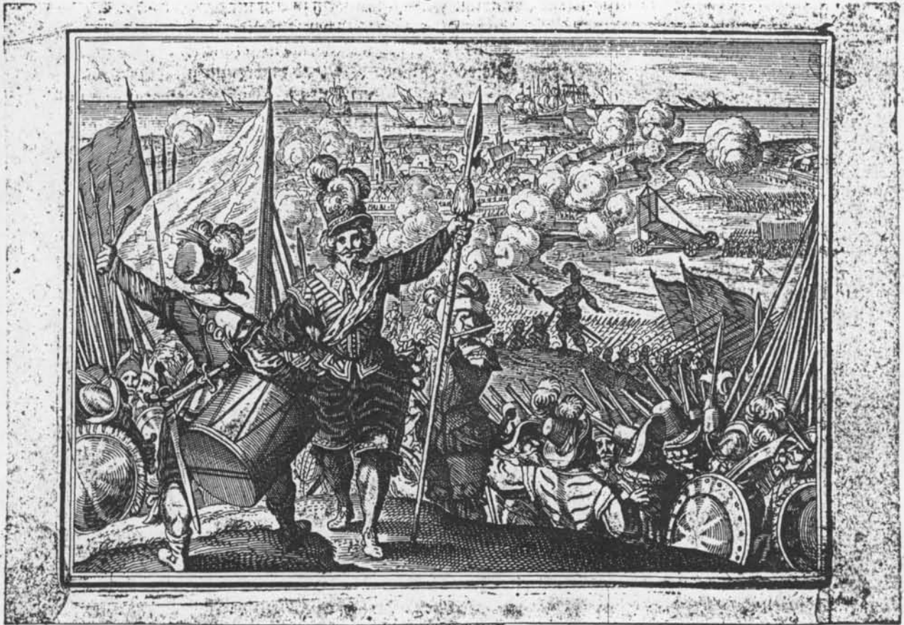
1.602. Sturm auf Oost- ende.