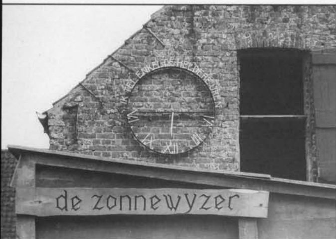
Poolstijlzonnewijzer van het verticale type op de boerderij van die naam te Snaaskerke