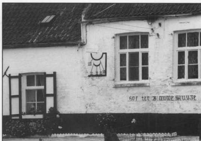
Poolstijlzonnewijzer van het verticale type op het hof "Ter Blauwe Sluize" te Bredene-Zuid-Oostwijk