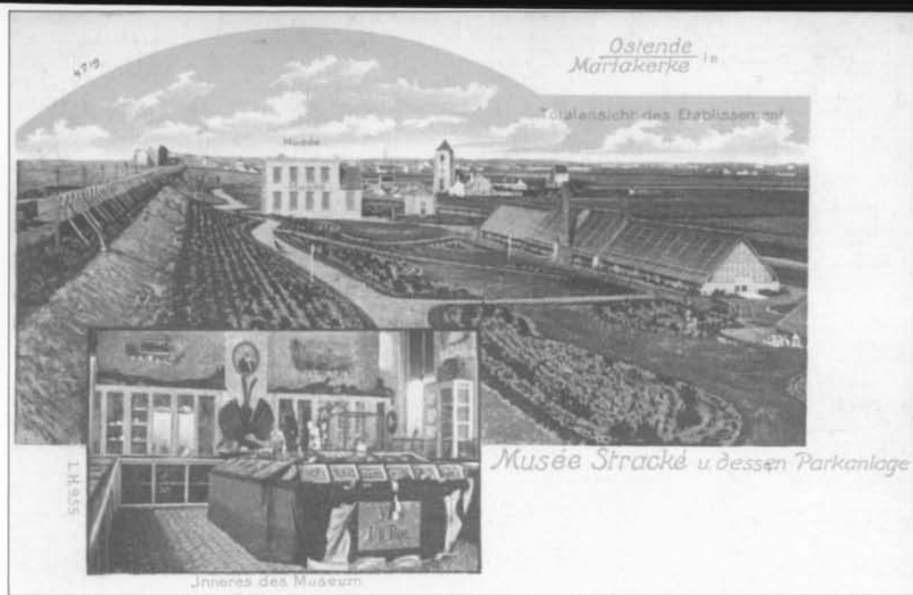
Gezicht op het museum in de Mariakerkse duinen (met park, serres, het Duinenkerkje) ca. 1898