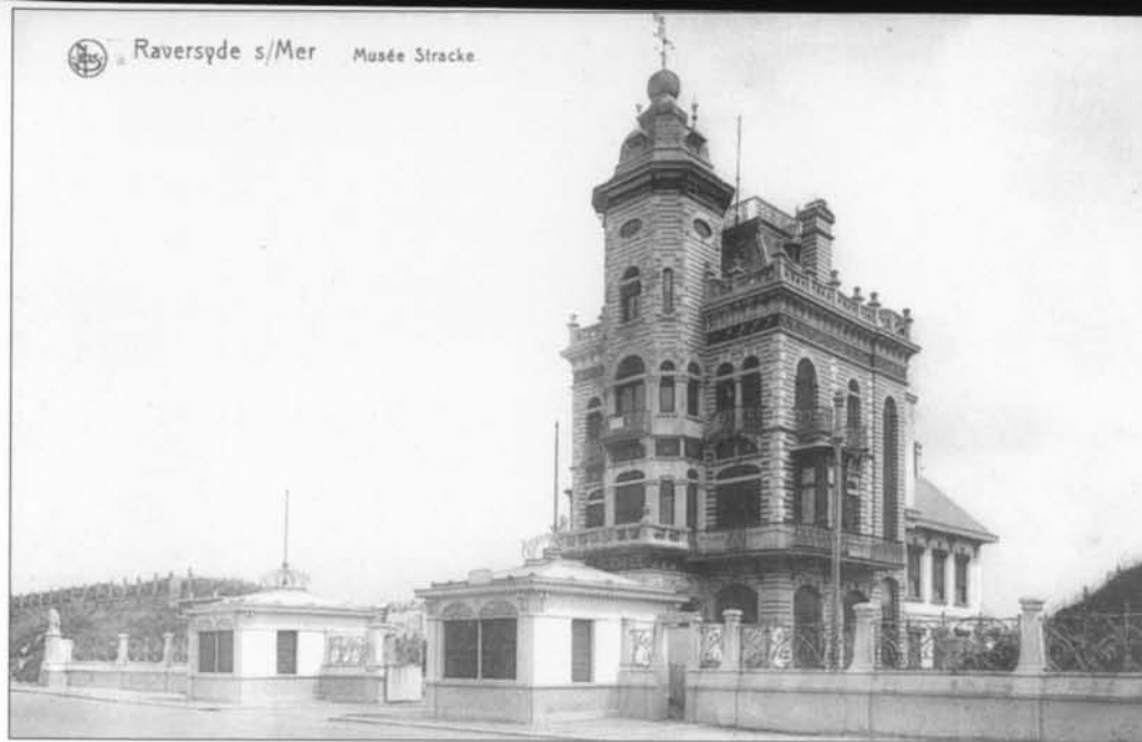
De villa van A. Stracké, vóór het museum, met de twee paviljoentjes (ca. 1903)