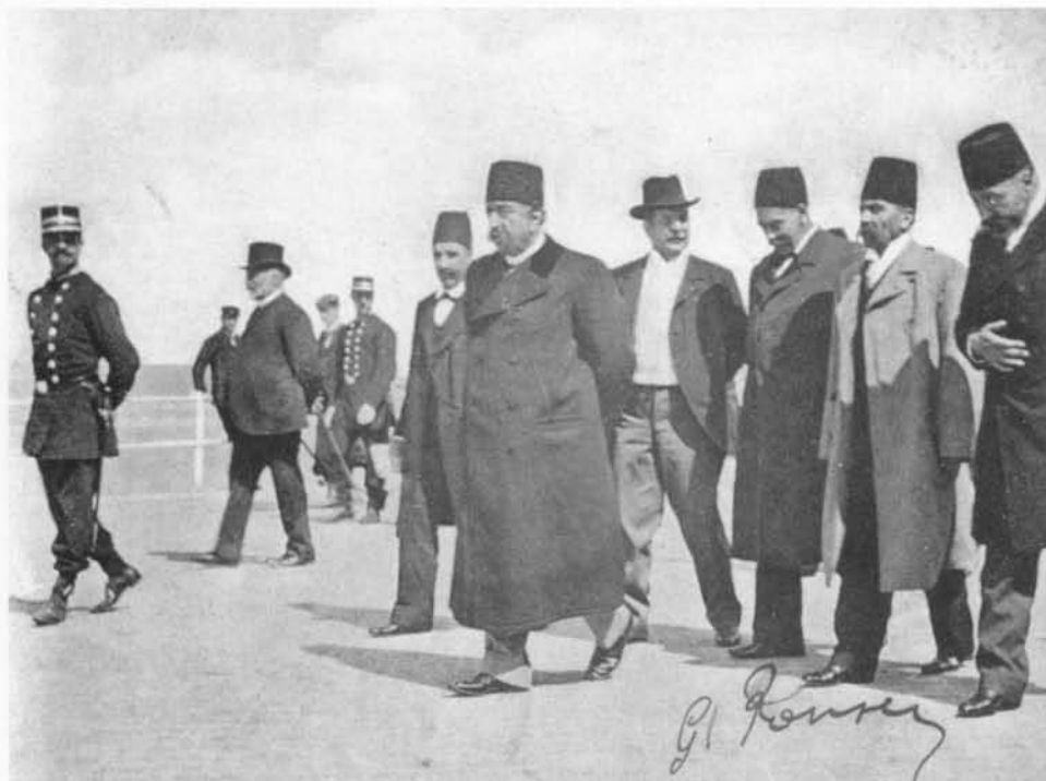
Sjah Mouzafer-Ed-Dine met zijn ministrieel gevolg op de zeedijk (1905).