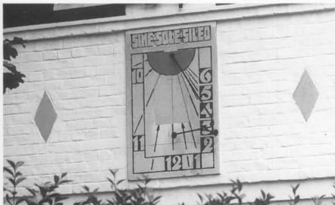
Poolstijlzonnewijzer van het verticale type. G. Carlierlaan, De Haan

In de omgeving van Oostende, De Haan en Gistel.