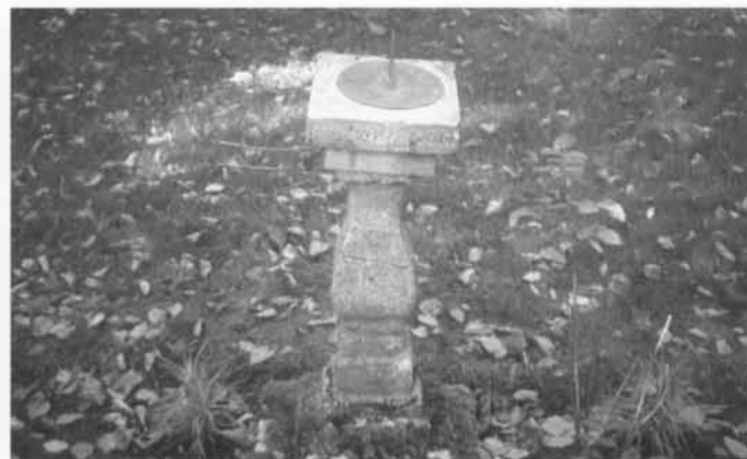
Poolstijlzonnewijzer van het horizontale type. Mosselstraat nr. 31, Gistel