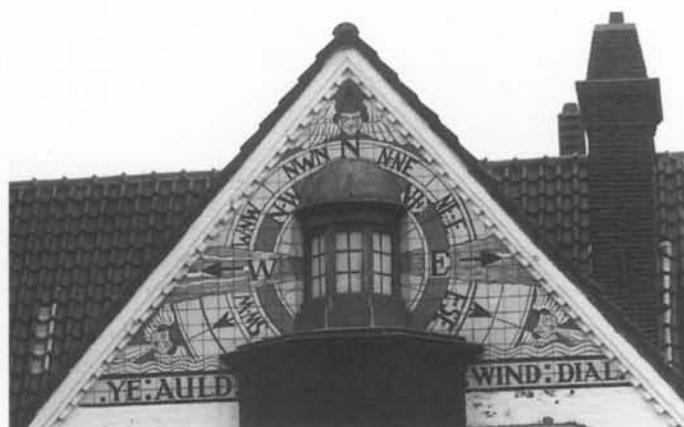
Als toemaatje een zeer mooie windroos. Orteliuslaan 8, De Haan