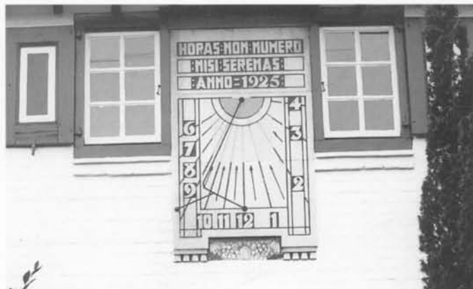
Poolstijlzonnewijzer van het verticale type. Rembrandtlaan, De Haan