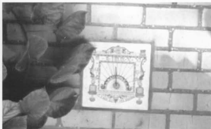
Poolstijlzonnewijzer van het verticale type. Mosselstraat nr. 29, Gistel