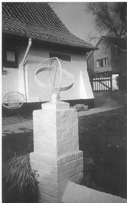
Sferische zonnwijzer G. Carlierlaan, De Haan.