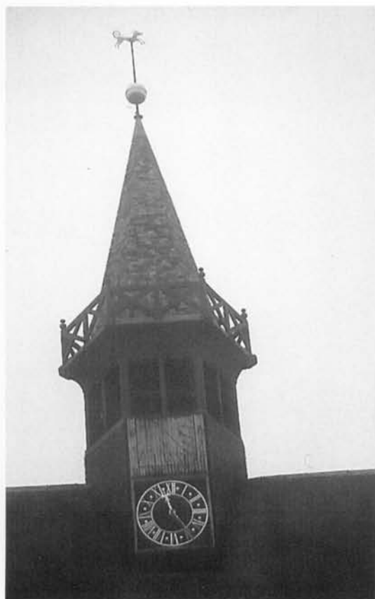
Poolstijlzonnewijzer van het verticale type op het stadhuis te Damme.