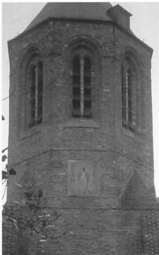
Poolstijlzonnewijzer van het verticale type op de oude H. Margarethakerk te Knokke.