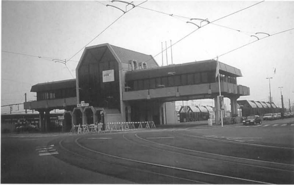
Vooraanzicht van het hoofdgebouw.