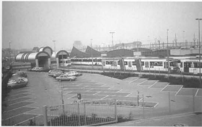
De mooi gemodelleerde olop, de wasinrichting voor het rollend materiaal en de parking.