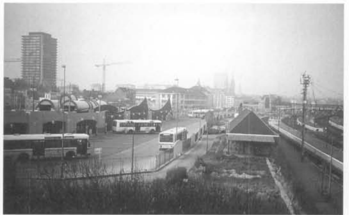
De olop van de oostkant gezien, en de parkeerplaats voor de bussen.