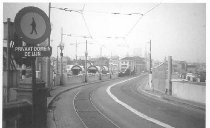
Zicht op de olop of "de Goede windhelling".