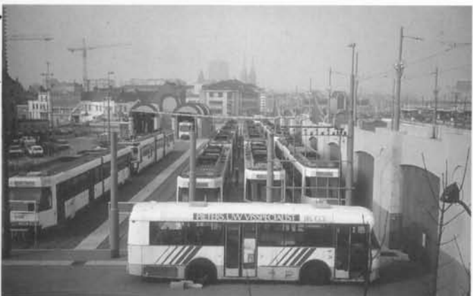
Het was woekeren met ruimte, maar met een prachtig resultaat.