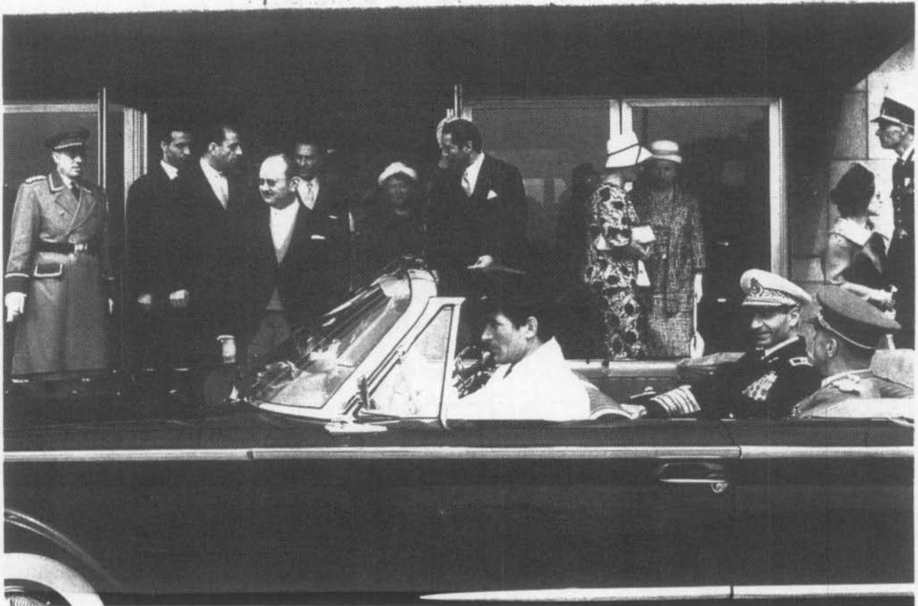
De Sjah bij zijn vertrek uit het Kursaal

Om 12.10 stappen ze dan opnieuw in de open wagens en vertrekken ze, op de tonen van marsmuziek langs de Leopold II-laan naar het kursaal. Op het plein voor het kursaal staan vier Oostendse folkloristische verenigingen klaar om op te treden : de Verenigde Vismijnvrienden, de Ijslandvaarders, het Loze Vissertje en de Gilles der Zee. In 10 minuten is dit optreden afgelopen en kan de Sjah het kursaal binnengaan. Na een kort bezoek aan het gebouw krijgt de Sjah de tijd om zich even terug te trekken.