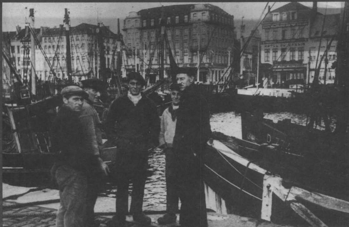
Vissers aan de eerste "Bassing" te Oostende.