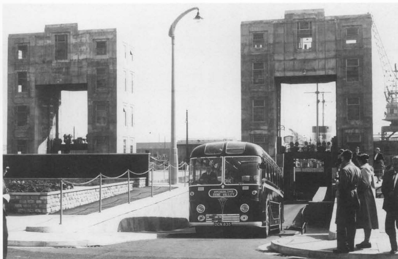
Aankomst te Dover