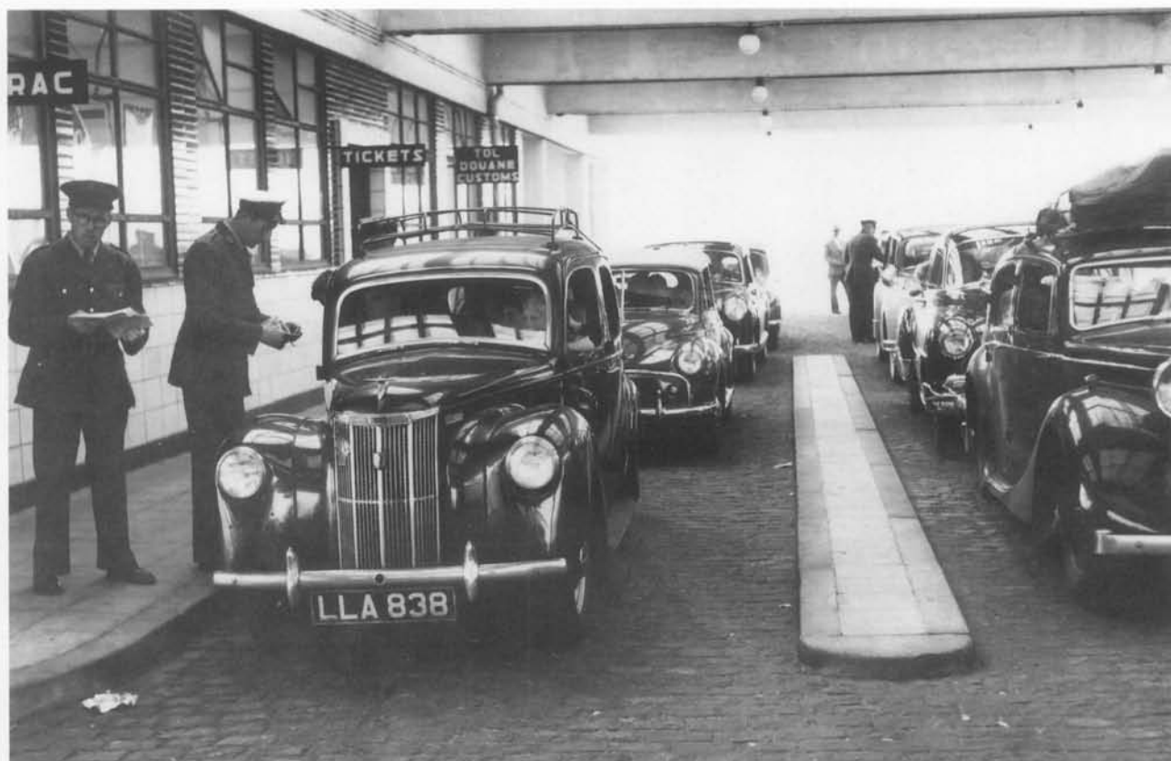
Vertrek te Oostende