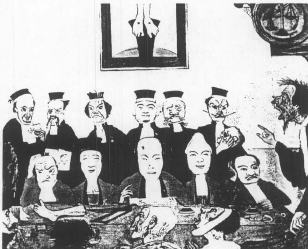
Ets "De goede rechters" van Ensor.

Voorzitter van de Rechtbank van Koophandel te Brugge