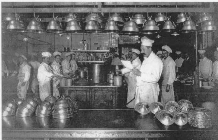
Keukenbrigade van het Ritz hotel te Parijs vergelijkbaar met die van het Royal Palace

Wat een eer voor Oostende want in de "Cuisine classique" van 1872 is er van een Oostendse bereiding geen sprake.