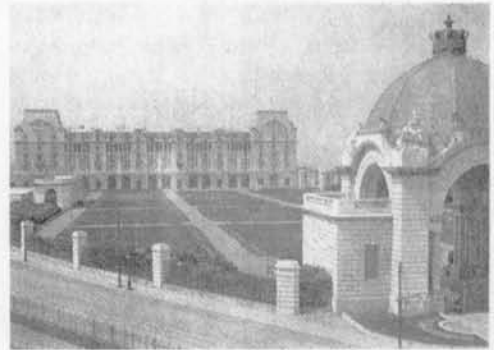
Royal Palace Hotel

Escoffier is in 1898 52 jaar oud en op het toppunt van zijn carrière. Hij reist Europa rond om keukenbrigades op te starten, lezingen te geven betreffende hygiëne in de keuken (toen al!) en grandioze feestdiners te dirigeren.